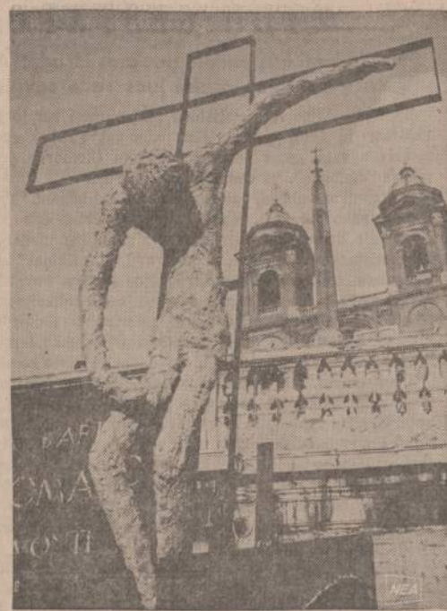
Taip moderniškai menininkai įsivaizduoja Nukryžiuotąjį. Jis kabos Romoje, prie ispaniškųjų laiptų. Paveikslas imtas saulei pakrypus vakarus.

— Tai gal tu bijais pirklio, siūlydamas jam ką parduot ar norėdamas iš jo ką sau nusipirkt?