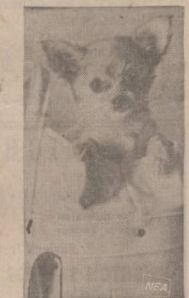
Dviejų mėnesių Chihuahua šunytis nešamas savininkės krepšyje. Šunytis eina ten, kur savininkė jį nuveda.

Kai mūsų konferencijose, kongresuose, seimuose ar kituose suvaziavimuose bus tik geros, turiningos ir gerai perduodamos kalbos, geri pranešėjai, geri paskaitininkai, kai bus tik savęs vertos, esminės diskusijos (grinėjama klausimais), kai nebus nereikalingų paklausimų ar šiaip kitų beprasmiškų įsiterpimų, tai, iš tikrųjų, mūsų suvaziavimų darbai bus produktingesni, negu dabar. Tą pat galima pasakyti ir apie mūsų eilinius visuomeninius susirinkimus.