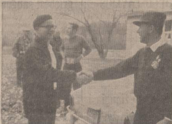
SVEČIAS IŠ OMAHOS VID. RAJONO SĄSKRYDYJE

Užsidekime nauja energija tęsti Liet. Skautų S-gos darbus. Įrodykite ne tik savo pavyzdžiu, bet ir nuolatiniu darbu su jaunaisiais, kaip įsigyti gyvenimo vertybių. Sykį tą supratimą įsigiję, jie pajus, kaip ir mes kadaise, natūralų norą žinoti. Tada jie lengvai išmoks tai, kas dabar yra taip sunku išmokyti — likti lietuviškas skautais šiame erdvų amžiuje.