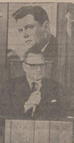
Richard B. Ogilvie Respublikonų kandidatas į Illinois gubernatorių. Ciceron lietuviu bankete ragina lietuvius stipriai remti savo kandidata V. V. Adamku, vienintelį emigrantų respublikonų sąrašą, ir iškelia jo atneštą energiją ir nuopelnus visam respublikonų sąrašui per einančią rinkiminę veiklą.

Klausimas. Prašau man padėti, daktare, nes niekur pagalbos negaunu. Pakausyje, kaip ketvirties cento plote jaučiu spaudus skausmą — skauda net galvą bei kaktą judinant. Iš tos skaudamos vietos eina skausmas j kaktą, o taip pat ir pakausį. Kaip man su tokiais galvos skausmais tvarkytis?