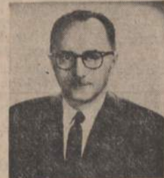
JUDGE THADDEUS V. ADESKO was appointed to the Appellate Court in 1966 by the Illinois Supreme Court. An outstanding jurist he served as Municipal Court Judge; Superior Court Judge and presiding judge of the County Division of the Circuit Court. Rated qualified by the Chicago Bar Association.