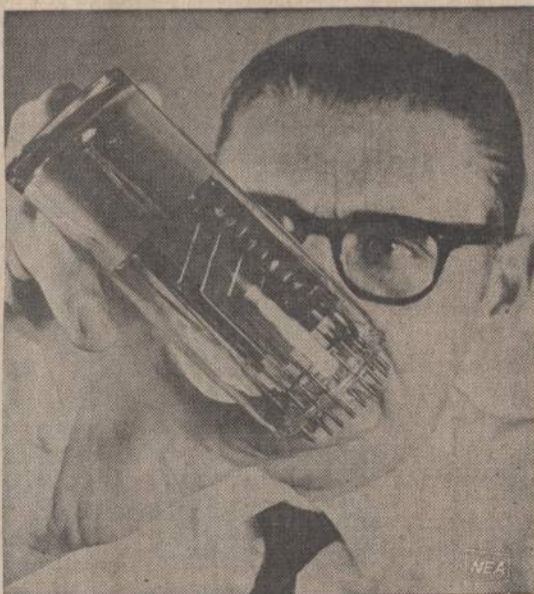
Paveiksle matome elektroninį prietaisą, kuris pajėgia užregistruoti trumpiausius šviesos spindulius, kurių negali pastebėti net žmogaus akis. Jis padės išsikinti, kaip augalai saulės energija paverčia maistu, ir nustatyti, kaip pulsuoja kai kurios tolimos žvaigždės.