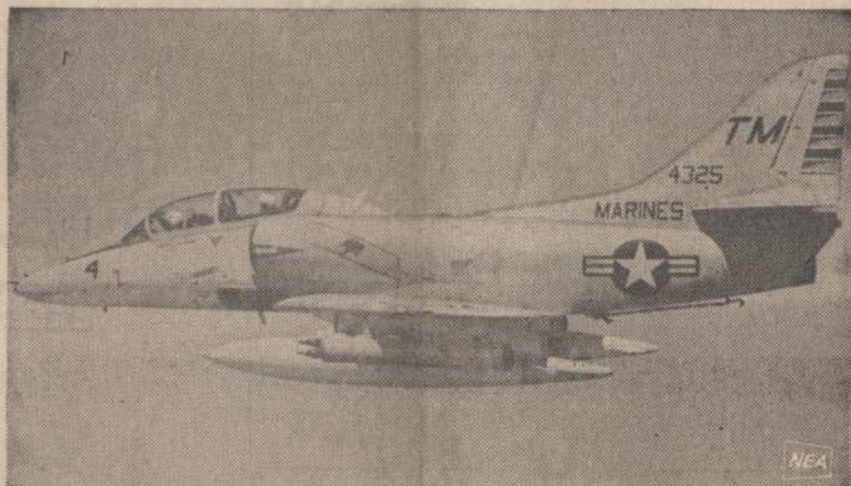
Amerikos karo lėktuvus padeda galingoms karo laivo New Jersey kanuolėms pataikyti į priešų apkasus. Demilitarizuotai zonoj skraidantis lėktuvus praneša karo laivui, ar jo šoviniai pataikyti tikslą.

Rugpjūčio mėnesį jie buvo pagauti prie Austrijos sienos. Jų automobilio priekaboje buvo pasislėpęs jaunas vokietis iš Rytų Vokietijos. Jis bandė pabėgti į Austriją iš Vengrijos. Vokietis