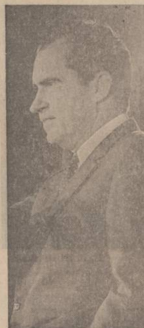
RICHARD M. NIXON

RICHARD NIXON yra nusistatęs garbingai baigti karą Vietname, lygiai kaip Prezidentas Eisenhower baigė karą Korėjoje.