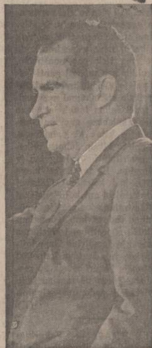
RICHARD M. NIXON