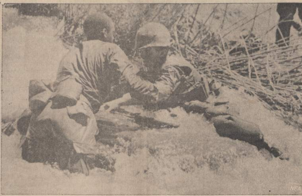
Vietnamo upės labai sraunios, kai smarkiau palyja. Amerikos marinas, anksčiau upelį perbrides, padeda kitam marinui išlipni iš vandens.

SEOULAS. — Trys šiaurės Vietnamo kareiviai buvo užmušti kovoje Pietų Korėjoje. Šeštadienį Pietų Korėjoje išsikėlė 30 komunistų kareivių. Iki šiol šeši buvo užmušti.