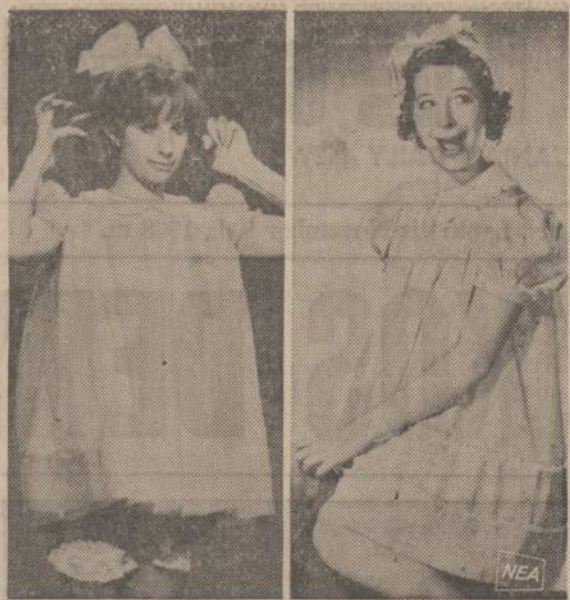
Dešinėje dainininkė Barbara Streisand fotografuota 1938 metais, o kairėje nuotrauka padaryta prieš šį savaitę. Visi gyvi sutvėrimai eina senyn, o dainininkė eina jaunyn.

Ar tikrai šie balsavimai — pasizymėjo smurtu ir nepaprastu suktybių gausumu, paaiškės vėliau, po rinkimų. Tenka turėti mintį, kad įkaitusiems politiniams veikėjams ir menki nesklandumai kartais atrodo sunkiais nusikaltimais, kai juos padaro kitos partijos žmonės.