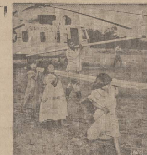
Panamos kainuose reikia pastatyti ligoninę pasimetusiai indėnų giminei. Raiti užtrunka dvi dienas, kol pasiekia kalnuose esantį kaimelį. JAV malūnsparnis nuvežė gyventojams 26 tonas įvairaus maisto, daugiausia Care slintinių. Be to, tas pats malūnsparnis atvežė lentų planuojamai ligoninei. Jaunos mergaitės padeda su- nešti lentas į vietą.

Dainininkė scenoje mirštan- čių balsu dainuoja: O jeigu aš būčiau paukštėlis padangėj... Balsas iš salės: O jeigu aš tu- rėčiau šautuvą... ● Kas turi šunį, neprivalo pats loti. (Japonų)