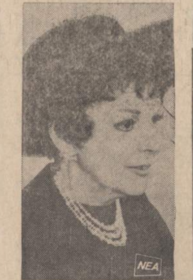
Judy Garland savo laiku buvo labai mėgiama dainininkė, bet šiandien jos programos jau ne tokios dažnos. Dabar jau dainuoja jos dukritė, Balso nekenkiant Judy Garland New York'e sukinišias dainininkę ir artistų tarpe.

ISNUOMOJAMAS GAZUS 4 KAMB. BUTAS suaugusiems 44 So. Artesian apylinkė. Skambinti tel. YA 7-1662