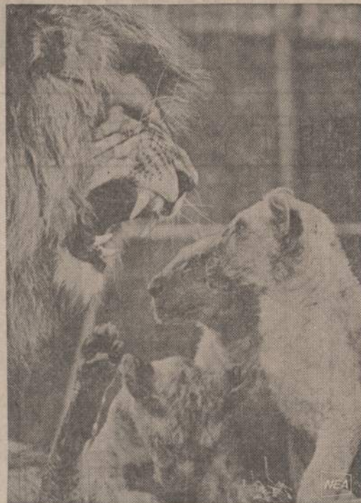
Senoji liūtė labai garsiai mauroja, bet jaunikliai nekrepia į tai jokio dėmesio. Matyt, kad ir pas gyvulius jaunikliai nesupranta vyresniųjų.

kai jis ką nors gauna. Mes ra-miamai čia gyvendami pradėjome reikauti — emėme nepasitenkin-ti daugeliu dalykais. Atsimin-kime, kad mes visai nutilsimė tada, kada mums niekas nieko neduos. Kai priešas pavergs šį kraštą — tada mes net burną atidaryti bijosime — visi tylė-sime ir, kaip avinai skerdykloje, savo eilės lauksime. Taip atsi-tinka belaisvių stovyklose. Kol belaisviai dar šio to gauna — jie visi protestuoja. — Girdi, mes namuose taip ir taip valgė-me, tokius ir dar kitokius val-gius gaminomės... O kai tie be-laisviai emė beveik nieko negau-ti — tada visi protestuotojai už-sirišo burnas.