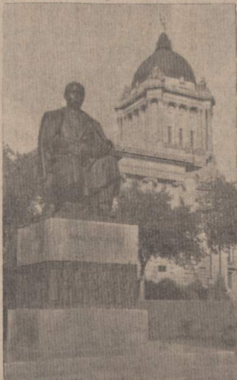
Taraso Ševčenkos paminklas Manitobos seimo parke, Vinipege.

St. Boniface kaip ir St. Vital priemiesčiai yra beveik grynai prancūziški, įsteigti ir apgyventi daugiausiai metisų, tai yra prieš anglams ateinant čia palik-