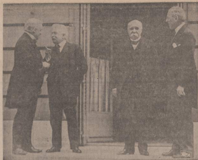
1918 metais paruoštos Versalio taikos vyriausieji vadai. Iš kairės į dešinę stovi britų premjeras Lloyd George, italų premjeras Viktorio Orlando, Prancūzijos — Georges Clemenceau ir JAV prezidentas Woodrow Wilson. 1935 metais Hitleris atmetė šių vyrų nustatytas taikos sąlygas ir pradėjo ginkluotis.

Melas. Ar girdėjo kada pasaulis didesnį melą, negu jį skleidžia rusiskasis komunistas — Sovietų Rusija". Armo-