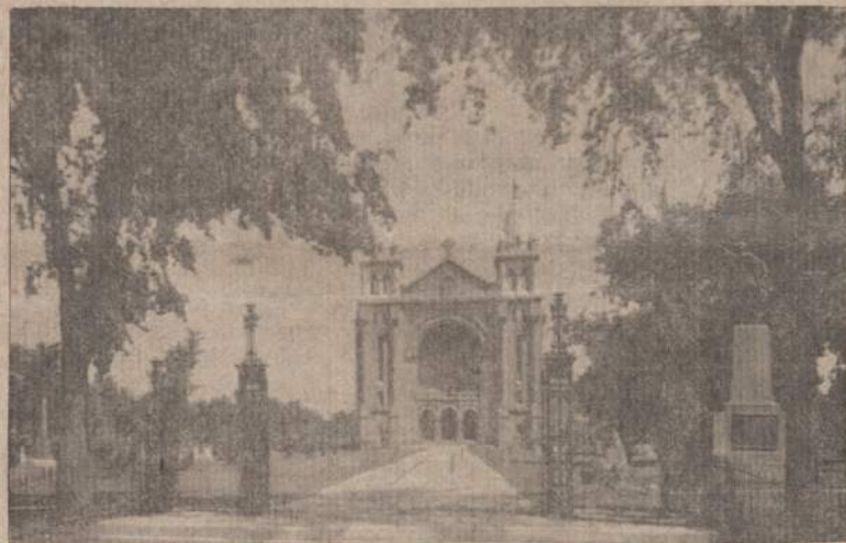
St. Boniface prancūzų katalikų katedra, kuri praėjus pavasarį visiškai sudegė, pridarant nuostolių, kaip apskaičiuojama, už puse milijono dolerių.