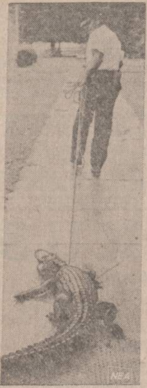
St. Petersburg, Fla., policininkas vėl ka mieste rastą alligatorių į ežerą. Policija buvo pašaukta, kai vieno namo savininkas, išėjęs ant gonkelio, rado jose labai gerai įsitaisiusių ir užmigusį alligatorių.