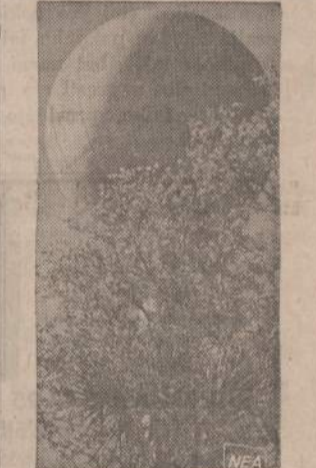
Daugelis gali pamanyti, kad tai kylančios mėnulio, balionas arba koks erdvėlaivis. Bet tikrovė yra kitokia. Tai St. Petersburg, Fla., miestelio vandens bokštas. Medžiai paslepia vandens rezervuaro pamatą, todėl ir susidaro apgaulingas vaizdas.

Dėl vietų rezervacijos reikia rašyti: Commission on Human Relations, 211 W. Wacker Drive, Chicago, Ill. 60606, Room 812.