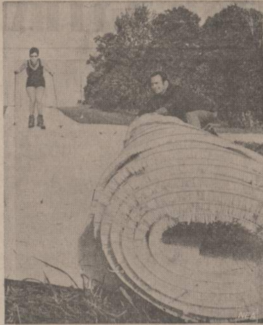
Surasta medžiaga, kuri sportininkams gali atstoti sniegą. Užtenka išristi į laukus didelius kilimus, kuriais pašiužininkai lengvai gali šliužti. Gerai apklojusais kilimais laukus, sportininkai galės šliužinėti ir vidurvasaryje.

Manau, kad ir Marquette Parko publika tokį teisėją būtų nusijuntusi švento Kryžiaus ligoninėn. Laimė, Meksikoje į sporto aikštę įbėgti negali, nes skiria gilus ravas!