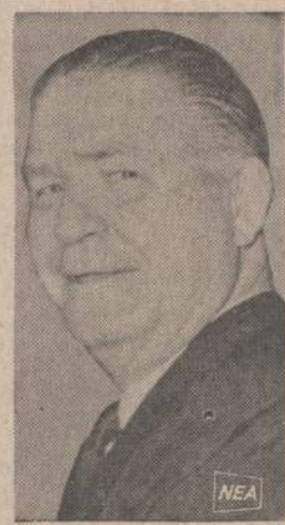
Ilgarsėjęs Houston, Tex., advokatas Percy Foreman sutiko ginti James Earl Ray, kuris kaltinamas Martin Luther King Jr. nužudymu. Adv. Arthur J. Hanes ir jo sūnus atsisakė ginti apkaltintąjį.

Britanijos užsienio reikalų ministerija, reikalaujama, kad sovietai sumažintų savo tarnautojų skaičių, nurodė, jog Britanija Maskvoje laiko 40 diplomatų, o sovietai Londone jų turi 79. Prieš metus sovietai turėjo 67 tarnautojus.