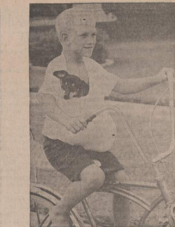
Floridoje berniukas rado labai saugų būdą savo šuničiui vežioti. Motina galės jį apiburti už mąsinių pertempimą, bet berniukas ir šunytis labai patenkinti.

"Taip, bet aš mat, nemoku plaukti. Jei teks atsidurti vandenyje, būsiu tikras, kad ponas puls mane gelbėti".