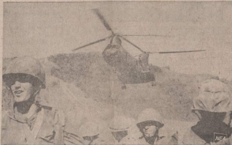
Amerikos marinai visą laiką ieško priešų Pietų Vietname. Į kiekvieną įtariamą vietą helikopteris nuneša karius, kurie patikrina visas landynas. Į paveiksle matome malūnsparniuo atneštus karius į demilitarizuotą zoną.

savo pareigas ir šiais Tarptautiniais Žmogaus Teisių metais pradėti nagrinėti Baltijos valstybių bylą.