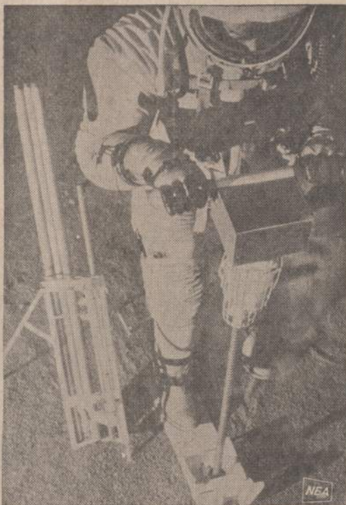
Mėnulio pasiūti astronautai turės pragražinti trijų metrų skylę, kad parvežtos drožlės galėtų padėti išaiškinti mėnulio paviršiaus sudėtį ir nustatyti jo temperatūros kryptį. Žemėje astronautai apmokina, kaip vartoti galingus gražtus.

SRINAGARAS. — Kašmire buvo suimti 24 asmenys, kurie Pakistano kurtomi planavę sabotazo veiksmus prieš Indiją.