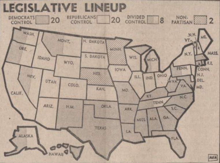
Praeitų rinkimų metu respublikonai laimėjo 50 vietų įvairių valstijų seimuose. Turint galvoje 1966 laimėjimus, šiandien respublikonai turi daugumą 20 valstijų seimuose. Demokratai kontroliuoja kitų 20 valstijų seimus. 8 valstijose balsai yra pasidalinę, o Minnesotoje ir Nebraskoje žmonės renka ne partijų atstovus, bet gabenčius ir padoresnius asmenis.

SAIGONAS. — Pietų Vietnamo komunistai raketomis apšaudė Da Nango karinius įrengimus ir pabėgėlių stovyklą. Raketos uždegė didelį Pietų Vietnamo karinį sandėlį ir padarė daug nuostolių. Pabėgėlių stovykloje buvo daug užmuštų ir sužeistų Amerikai sustabdžius Šiaurės Vietnamo bombardavimą komunistai apšaudė didesnius gyvenimų centrus jau 68 kartus. Prezidentas Johnsonas, paskelbdamas apie oro puolimų sustabdymą, pareiškė tikėjimą, kad komunistai neapsaudys miestų ir nepiknaudos demilitarizuotos zonos. Saigono vyriausybė nurodo, kad komunistai jau sulaužė abu pažadus.