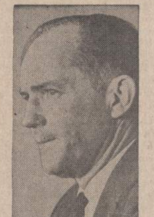
Gen. S. C. Phillips, Apolo programos direktorius, turės nuspręsti, ar gruodžio mėnesį siųsti tris astronautus į Mėnulį, ar neįsiųsti. Jeigu viskas bus paruošta, tai trys astronautai bus iškelti į erdvę, paskrajojus aplinkui Mėnulį ir vėl sugrįžti į žemę.

Britanijos karalienė sugrįžo iš savo ilgos kelionės po Pietų Ameriką į Londoną.