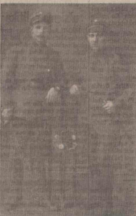
1919 metai. Lietuvos Armijos Kareiviai.

Deja, neilgai teko Lietuvos kariui džiaugtis kūrybingu, laisvu ir nepriklausomu gyvenimu.