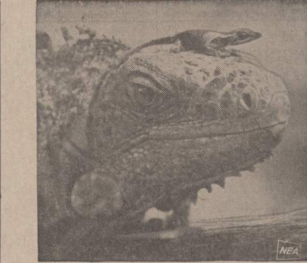
Floridoje chameleonas, užlipęs ant mižiniškos 5 pėdų iguano gal- vos, dairosi, kas darosi aplinkui. Iguana nekreipia dėmesio į ne- didelį šilutą.

— Lietuvių Filatelistų Draugijos "Lietuva" narių susirinkimas įvyks š. m. lapkričio mėn. 26 d. 7 val. vak. Jauimio Centre. Draugija išigijo pro- jektoriaus, kuriuo susirinkimo metu bus demonstruojami Lietuvos pašto ženklai su paaiskinimais. Nariai ir sve- čiai kviečiami skaitlingai dalyvauti. Draugijos biuletenis jau išėjo ir pa- siųstas nariams.