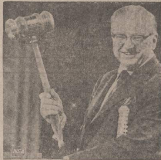
Miami Beach miestely vykusios respublikonų konvencijos pirmininkas Ray Bliss. Išrinktas prezidentas. Nixon įpareigojo Bliss paruošti dirva ateinančioms rinkimams, kad respublikonai gautų daugumą kongrete.