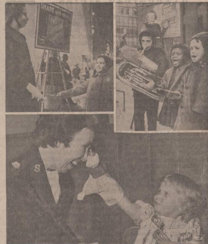
Amerikoje visiems pažįstama Salvation Army ruošia rinkliavas švenčių metu. Paveikslė matome įvairius aukų rinkimo vaizdus. Salvation Army nariams aukas rinkti padeda įvairaus amžiaus vaikai.

Negalima pasakyti, kad Walkerio raportas jau yra paskutinis žodis, atseit, visiškai bešališkas. Tačiau jis vis dėlto yra žymiai geresnis už anksčiau paskelbtus, kurie sukėlė daug triukšmo, bet mažai teprisidėjo prie bešališko viso reikalo nušvietimo.