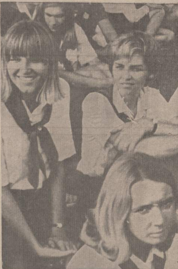
MŪSŲ SESĖS AKADEMIKES PENKTOJE TAUTINEJE STOVYKLOJE