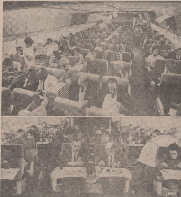
Naujai statomų Lockheed ir Douglas lėktuvų vidaus vaizdas. Šie lėktuvai pradės skraidyti tik-tai 1970 metais, bet šiandien jau galima matyti, kaip keleiviai bus aptarnauti maistu.

♦ New Yorke demonstruoja viduriniųjų mokyklų vaikai. Dvi mokyklos uždarytos. Policija suėmė keliasdešimt triukšmadiarių.