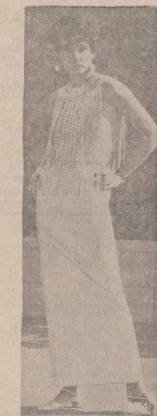
Pati naujausioji moteri apranga va- karo baliams. Šiame šone, bet bluokutės visai nėra. Krūtine den- gia karoliai, pakabinti ant kelių siu- ly eilių. Ant nugaros karolių juoste- lės yra retesės.

REMKITE TUOS BIZNIERTUS, KURIE GARSINASI "NAUJIENOSE"