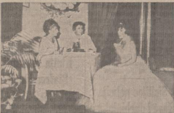
LOS ANGELES TEATRO SCENA IS A. KAIRIO "DIAGNOZES", REZ. J. KARIBUTAS.

Žiūrovas greit pamiršo vaidinimą — jis scenoje matė gyvenimą su nepaprastai gerai išryškintomis gėrio ir pikto kovos savybėmis. Pats veikalas, turbūt, gana statiškas, nėra jokių intrygos, kurioje žodis žodį ar veiksmas veiksma stumtų. Autorius režisieriui ir aktoriams užkrovė neįprastą našta: kaip