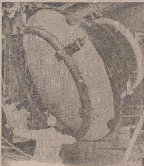
Kalifornijoje, North American Rockwell dirbtuvėse, pasveriamas kiekvienas erdvėlaivis ir sudėtinės jo dalys. Turi būti žinomas kiekvienas svaras, keliamas į erdvę. Paveiksle matome darbininkus, sveriančius Apolo 8 erdvėlaivį.

Pietų Korėja spaudžia Ameriką duoti jai daugiau ginklų, nes didėja komunistų infiltracija.