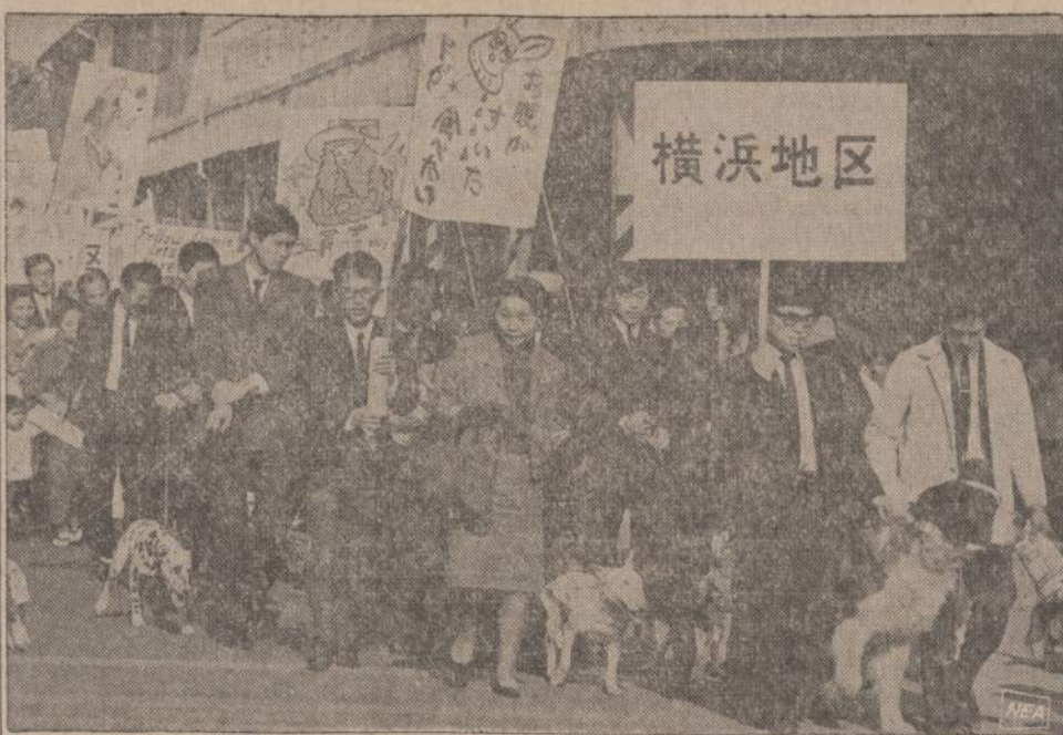
Penki tūkstančiai japonų — šunų mėgėjų protestavo prieš prekybos ministerio nutarimą uždrausti įvežti Amerikoje gamintą maistą šunims. Daugelis buvo paruošę plaštatus ir atsivedė šunis. Japonai tvirtina, kad Amerikoje gamintas šunų maistas yra daug skanesnis ir sveikesnis.

leistas bendradarbiavimas su kraštu neatsiduoda vergo kvapeliu. Ko jio siekiama? Ir ar jio pasiekima lietuvių tautos buities pagerinimo?