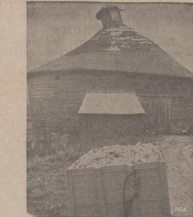
Brownstown, Wis., apylinkėje bernė nulenė savo keptuvę. 64 metus ji atkakliai gynėsi prieš šiaurės vėją, bet šį rudenį, šiaurui smar- kiaučiau pūstelėjus, bernė keptuvę pakrypo į pietus. Pavasarį ūkinin- kas turės taisyti seną savo bernę.

SOPHIE BARCUS RADIJO ŠEIMOS VALANDOS Visos programos iš WOPA, 1490 kil. A. M. Lietuvių kalba: kasdien nuo pirmadienio iki penktadienio 10-11 val. ryto. — Šeštadienį ir sekmadienį nuo 8:30 iki 9:30 val. ryto. Vakarų laikas: Pirmadieniais 7 v. v. Tel.: HElock 4-2413 7159 So. MAPLEWOOD AVE. CHICAGO, ILL. 60629