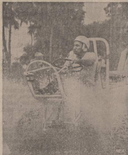
Floridoje, Naples srityje, giliame mylios purvynėlyje, eina lenktynės. Paveiksle matome automobilistą, baigiantį savo mašiną persiurti per purvyną.

Siais laikais kai kurie gydytojai savo pacientams pasako, kiek jie turi per dieną suvartoti tų kalorijų. Jei žmogus daugiau sėdi, nieko nedirba, tad užtenka maždaug 2,500 kalorijų; jei vidutiniškai dirba, tad užtenka 3,000 kalorijų; jei sunkiai dirba, tad reikia maždaug 4,500 kalorijų. Taigi, kai kurie žmonės, klausydami savo gydytojų patarimo, stengiasi mažiau suvartoti tų kalorijų. Tokiais atvejais pasidūri į tų kalorijų rodyklę ir pasirenka sau maistą su mažesniais kalorijomis. Bet vartodami patiekalus su mažesniais kalorijomis kartais tų patiekalų, dažniausiai labai gardžių ir skanių, suvartoja tokį kiekį, kurie sudaro tų kalorijų didelį gausumą ir tokiu būdu tų kalorijų iš tikrųjų suvartoja daugiau, negu valgydamas kokius