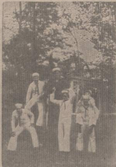
Clevelando jūrų skautai rudens sezoną gamtoje, parke. Jauniai džiaugiasi — gaudo paskutinuosius saulės spindulius...