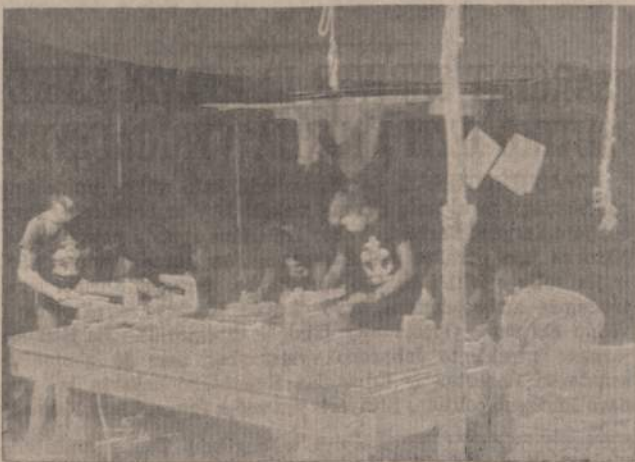
PRASIDĖJO ŽIEMOS DARBAI UZDARUOSE BOSTUOSE Čičagos Lituanicos tunto skautai ruošiasi Kaziuko Mugei