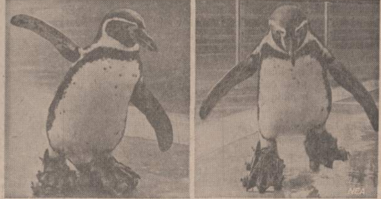
San Diego zoologijos sodo pingvinas Rolly per tris mėnesius gražiai pramoko čižuoti ratukais. Dabar kiekvieną dieną jis linksmina zoologijos sodo lankytojus gražia lygsvara ir puikiu čižu-timu. Buvo padaryti specialūs ratukai, tinkami jo kojoms.

dar kiti užsinerėja miego; taip ir išsiskirstė. Išėinant dar nugirdau tokį pašnekesį: