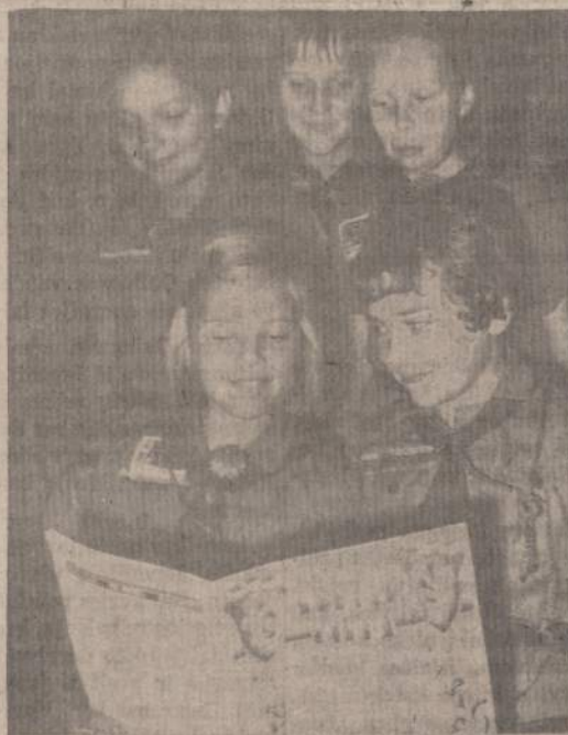
"KAS NESKAITO SKAUTŲ AIDO — PAMATYSI TUOJ IŠ VEIDO"