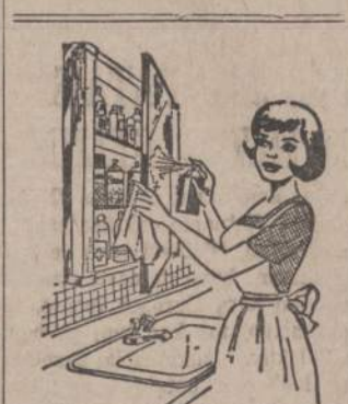
Savo naminę vestų spinte'e reikia nepaprastai švariai ir tvarkingai užleikyti, kaip šiame vaizdelyje parodyta: išimti visas bonkutes ir išmągoti lentynas; patikrinti visus užrašus, kad neįvyktų klaidų, nes vestų su maitymas gali būti fatališkas. patikrinti, kokiu vestų trūksta ir juos papildyti kad būtų bet kokiam neti ketumui pasiruošęs.

Sykį Čikagos lenkai ir italai susitarė tarpusavyje sulošti futbolą. Sumanyta — padaryta, bet jau ketvirtas kėlimas baigėsi su nuliais abiejose pusėse. Prieš pradėdant penktąjį kėlimą,