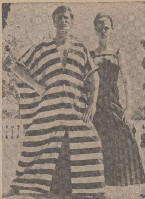
Atrodo, kad ateinantį pavasarį paplūdimiuose bus nešiojami pavėksle matomi drabužiai.

Ir visa tai lengvai gali pateikti ruošiamo jubilėjinio metraščio redakcijai. Išties ranka, pamk šiaandien, nes rotyj, kai jau bus reikalinga vartyti mūsų laikraščių kompleksus ir iš jų rankioti