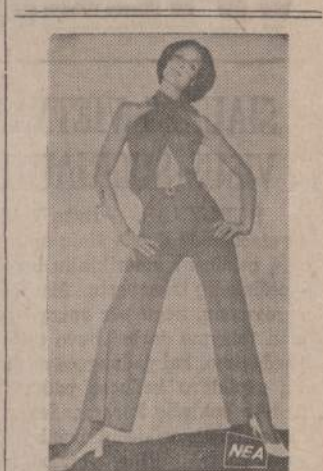
Paryžiuje kitan pasaulin paskesti mągstantiems žmonėms gaminamas šitoks vakarinis aprėdalas. Ar jis plačiau prigis, tuo tarpu sunku pasakyti, bet hiųių ir jipių Paryžiuje visą laiką nefrūko.

BIZNIERIAI, KURIE GARSINASI NAUJIENOSE — TURI GERIAUSIAU — TAD GARSINKIS IR TU.