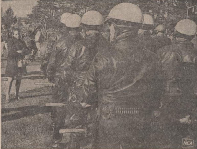
Valstybinėje San Francisco kolegijoje neramumams kelia apie 400 studentų, tuo tarpu didelė — 18.000 studentų dauguma ramiai mokosi. Prof. Hayakawa yra pasiryžęs naudoti policiją maitaujantiems studentams suvaldyti. Policininkai neleidžia nestudentams veržtis į mokslo įstaigos kiemus.

UMUAHIA. — Biafros valdžia paskelbė, kad Nigerijos ketrū lėktuvai puolė civilius gyventojus Umuahia mieste, užmušdami 27 asmenis ir sužeidami 100.