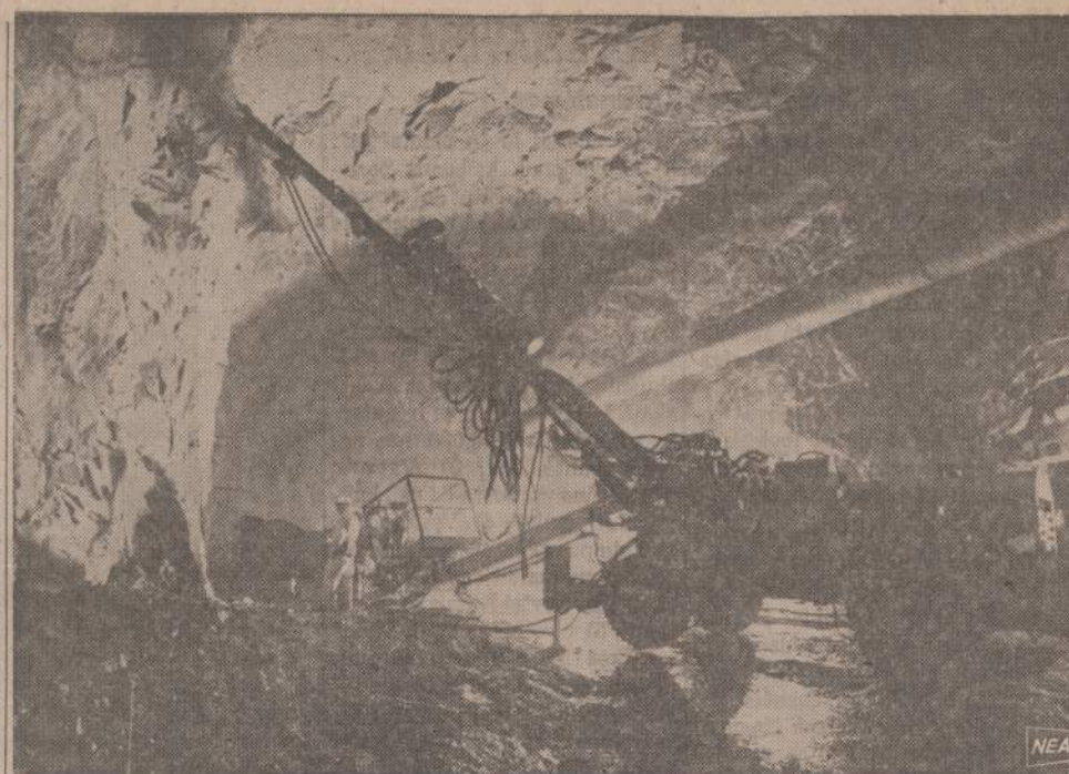
Niufoundlande inžinieriai granite prakirto vienos mylios tunelį, kuris bus naudojamas elektros stočiai. Stoties statybos darbas pradėtas 1966 metais o bus baigtas apie 1976 metus.

Būtų gera, kad ir ateityje joki guduragalviai nesikėsintų į Lietuvos laisvinimo darbu skiriamas ir Amerikos Lietuvių Tarybai siunčiamas aukas.