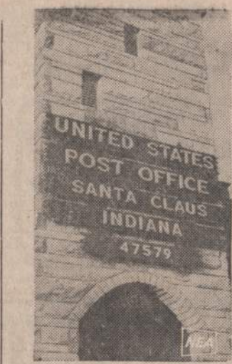
Indianoje yra pašto istaiga, kuri vadinasi Santa Claus. Miestelyje gyvena apie 50 gyventojų, bet Kalėdų metu paštas gauna apie milijoną laišku ir sveikinimų.

PLOKŠTELES pareikalavimui yra geriausia ir gražiausia dovana bet kuriai progai. Naujausias lietuviškos ilgo grojimo plokštelės. (Taip pat Kalėdinės). Rašykite ir prašykite mūsų nemokamai katalogo: REQUEST RECORDS, INC. 66 MECHANIC ST. NEW ROCHELLE, N. Y. 10801