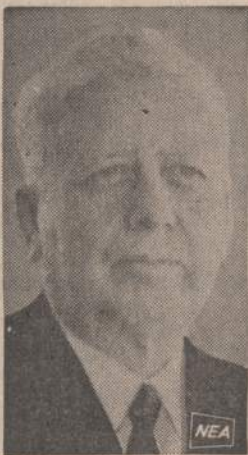
David M. Kennedy

naujai išrinkto prezidento R. Nixono yra paskirtas susisiekimo sekretorium.