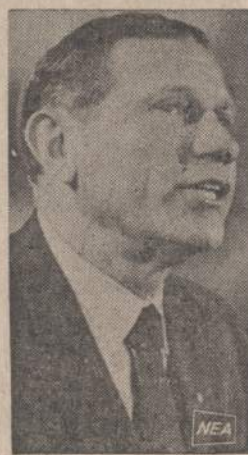
John A. Volpe

DACCAS. — Pakistane policija tvarkydama riaušes peršovė 9 asmenis.