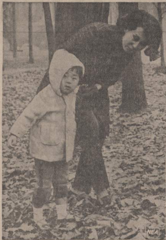
Ponia Nguyen Cao Ky, Pietų Vietnamo viceprezidento žmona su 3 m. dukrele vaikštinėja Paryžiaus parke. Viceprezidentas Ky Paryžiuje dalyvauja taikos pasitarimuose.