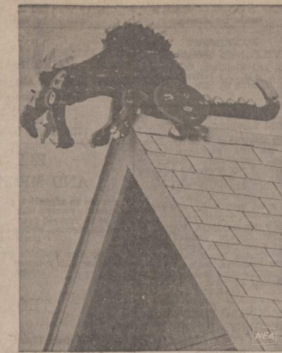
Wisconsin valstijoje, Browntown miestelyje visi žmonės kalba apie naujai pastatytą namą ir ant stogo patupdytą dragoną. Norvegai ant savo stogų tupdydavo ir tebetupdo tokius dragonus. Tvirtinama, kad jie atneša žmonėms laimę, nes tupintis dragonas pasikalba su kiekvieni u nama įžengiančiu žmogumi.

I šio klubo patalpas labai len- gras atvažiaivimas iš visų kraš- tų, nes du U. S. vieškeliai prive- ža netoli salės: 92 viešk. priveža prie mažojo kelelio, kuris atve- da ligi durų; ten antkampo yra stambus užrašas: "Lithuanian Club". Antrasis yra greitkelio nume- ris, ketvirtas, kurs atveda į 92 Hwy, visai netoli nuo U. S. 301. Prašau pasilaikykite ma-