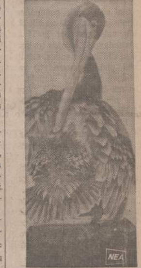
Jei niežti, šis paukštis turi nuosavą snapą pasikasyti.

• Užteko, kad vienas vyras įsimylėtų į vieną moterį, kad pasaulis pataptų toks, koks jis yra. (Voltaire)