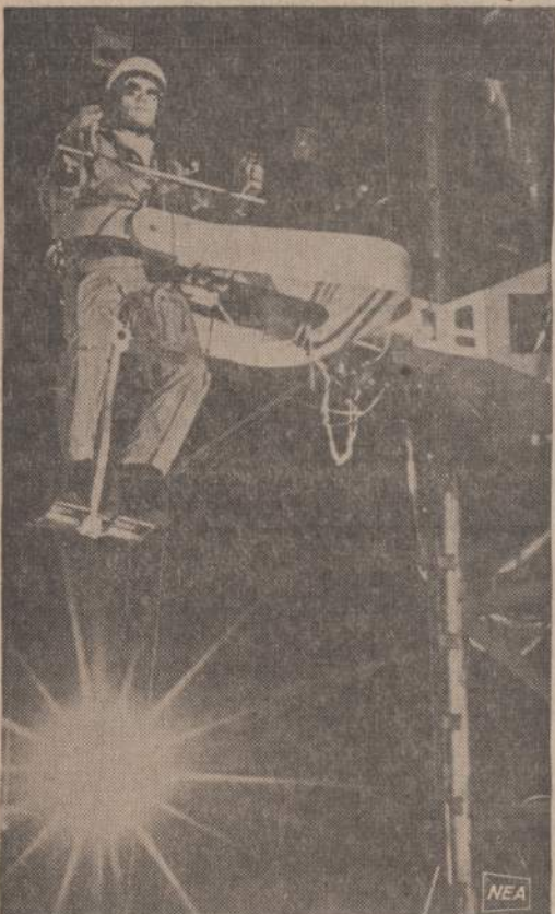
Astronautas Bruce McCandless tikrina "erdvės pasivaikščiavimo" instrumentus erdvės tyrimo bazėje Denver.

Istaigos pietuose kiemas automobiliams pastatyti