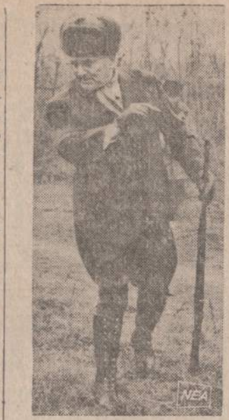
Jugoslavijos prezidentas Tito Belgrade apylinkėse pradėjo šių metų medžioklės sezoną. Paveiksle matome Jugoslavijos komunistų vadą, besileidžiantį į bruzgynus kiškių ieškoti.

Vietų skaičius ribotas, reikia tuojau registruotis. Pildome aplikacijas tiems, kurie 1969 metais norėtų porą mėnesių praleisti Lietuvoje pas gimines. Išskviečiame žmones iš Lietuvos. Parūpiname bilietus į užsienius ir į visus Amerikos miestus.