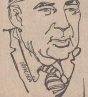
Naujai išrinktas prezidentas Nixon paskyrė teisininką John N. Mitchell valstybės gynėju.

SAN JUAN. — Garsus violončelistas Pablo Casals sulaukė 92 metų amžiaus.