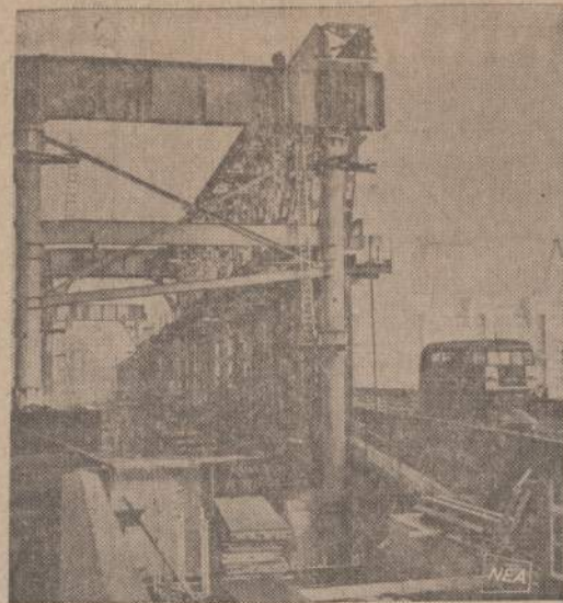
Paveiksle matomi pilno stulpai ir stramos padeda išardyti per Temzė eįusj Londono tiltą. Jis vežamas Amerikon, Havasu miestelin. Arizonos milijonierius, nusipirkęs garsų tiltą, tikisi padidinti savo turtus. Tuos pačius pilno stulpus naudos naujam tiltui statyti.

Tačiau taip reikalai sparčiai nėjo, kaip seniūnas manė. Mano