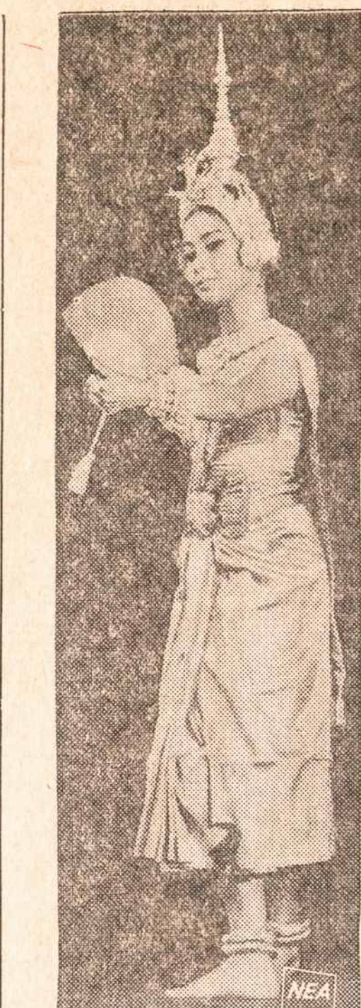
Kambodžijos valstybės galvos, princas Sihanuko dukterė Norodom Buva Devi, tradicinės šventės metu šoka Pnnonm Penh miestelyje. Ji pasidabinusi specialiais tradicinės šventės drabužiais.

Kad nesušlapytų ir neperšaltų, sporto mėgėjas ištaisė megztinį veidui nuo šalto vėjo ir sniego apsaugoti. Jis netik ramiai sėka žaidimą, bet pro paliktą plyšį gali net cigara rūkyti.