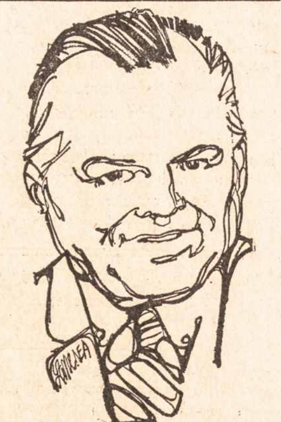
Naujai išrinktas prezidentas Richard M. Nixon paskyrė teisininką Walter J. Hickel vidaus reikalų sekretorium.

Derybas sustabdė Vietnamo komunistinio "Laisvinimo Fronto" pripažinimo klausimas. Komunistai reikalauja, kad jie galėtų dalyvauti derybose, kaip pilnateisiai derybų dalyviai, kaip atskira, nepriklausoma jėga. Su tuo nesutinka Saigono vyriausybė. Sakoma, kad Hanojus reikalauja, kad Amerika pašalintų iš Saigono valdžios viceprezidentą Ky. Šiek tiek ginčų atsiranda ir dėl Amerikos žvalgybos lėktuvų skraidimo virš Šiaurės Vietnamo.