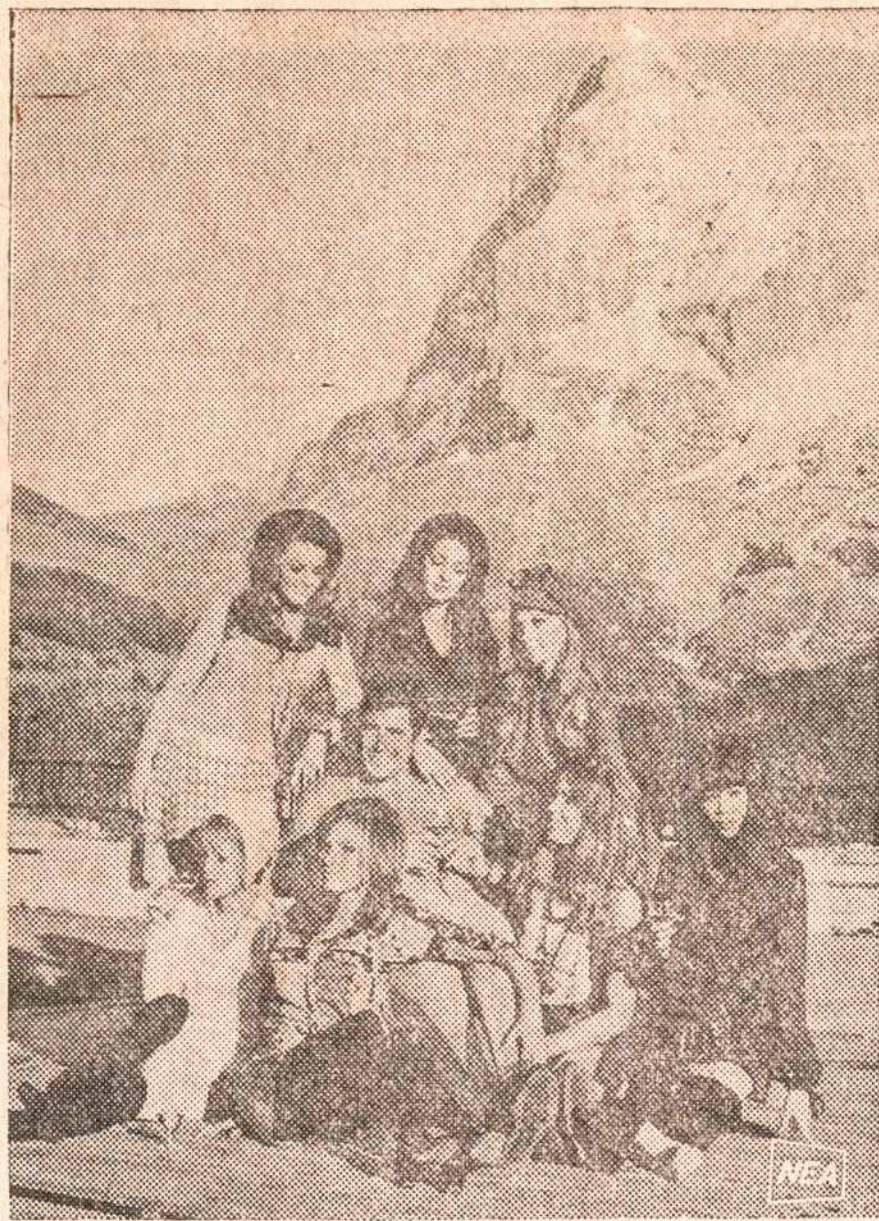
Australijos kino artistas George Lazenby Šveicarijoje suka naują filmą. Paveiksle matome jį kartu su septyniomis svarbiausiomis vaidintojomis.