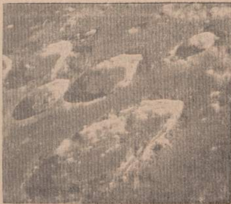
Pasaulis, kur gyva koja dar nėra įmynusi pėdsako.

"radijo — pulsuojančiais dangaus laikrodžiais", sutrumpintai pulsarais. Juos iki milijono bilijoninės dalelytės patikrinamo kalifornijos Technologijos Institutas savo tiksliausiais atomiais laikrodžiais. Tie patikrinimai parodė, kad pulsarai tikrai yra vienas iš ekstrordinariškiausių gamtos ritmo fenomenų. Astronautai jau galvoja, kaip pulsarų signalus bus galima išnaudoti kada nors pradėjus navigaciją į tolimuosius pasaulius, kadangi pulsarų kitaiip neįmanoma išaiškinti, kaip navi-