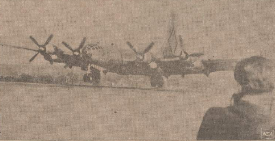
Paveiksle matomas Amerikoje statytas lėktuvas "Laimingoji Ponia II", 1949 m. kovo 2 dieną be sustojimo apskrido aplinkui pasaulį. Lėktuvas pakilo iš Fort Worth, Tex., aerodromo, per 94 valandas apskrido aplinkui pasaulį, ir vėl laimingai nusileido tame pačiame aerodrome. Tai buvo didelis aviacijos žingsnis pirmyn.

Užsienio reikalų ministeris Ebanas pareiškė, kad Izraelis ateityje politiką "aktyvios gynybos" politiką ir puls partizanų stovyklas.