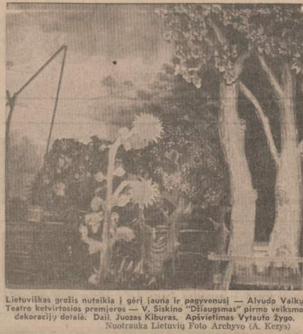
Lietuviškas grožis nuteikia į gėrį jauną ir pagyvenusį — Alvydo Vaikų Teatro ketvirtosios premjeros — V. Siskino "Džiaugsmas" pirmo veiksmo dekoracijų detalė. Dail. Juozas Kibaras. Apšvietimas Vytauto Žygo. Nuotrauka Lietuvių Foto Archyvo (A. Kezys)

Gydo pats organizmas, ne vaistas, ne autoritetas. Pajėgumas gintis yra pačiame organizme, pačiose celėse. Jeigu jor-se nebėra galių, ką padės stimuliantas vaistas? Paskatina enzymus... jeigu jų "sąskaitos tuščios", tai tik padės numirti. Gy-