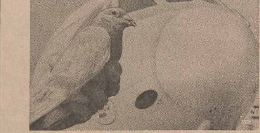
Mokslininkai ir geriausiai lakūnai stato priemones lėktuvams valdyti ir tiksliam skridimui nustatyti, bet paprastas karvelis greičiau ore orientuojasi ir mirčiau skrenda. Mokslininkai tyrinėja karvelių skridimus, kad galėtų pasimokyti iš paukščių. Tyrinėjimai vedami dešimtmečiais, bet iki šios dienos joks lakūnas negali taip skraidyti, kaip skraido paukščiai.

Buvo rašoma laikraščiuose, kad 1966 metais kovo mėn. 22 dieną Vilniuje buvo pasirašytas 22 mokslininkų ir kultūrininkų memorandumas prieš okupantą, kad sustabdytų numatomą prie Jurbarko naftos perdavimo įmonės statybą. Tas memorandumas buvo pasiūstas rusų planavimo Komisijai. Mes čia visi skaitydami laikraščius, be jokio dėmesio viską praleidome. Aprašė, kad iš įmonės einantieji chemikalai užnuodys aplinkinių upių vandenį ir išnaikins gyvūniją, nuo dūmų išdžiūns augmenija. O jau šių metų pradžioje tie patys laikraščiai rašo, kad 1970 metais bus pradėta statyba, nes okupantas nepaklausė savo vergų protesto. Jeigu pavergtieji išdrįso pareikšti protestą prieš pavargęją, kodėl laisvame pasaulyje esantieji lietuviai mokslininkai visi tyli? Čia yra "Lietuvių profesorių sąjunga, Lietuvių inžinierių ir architektų sąjunga, ir Lietuvių miškininkų sąjunga, o taip pat Jurbarkiečių ir Tauragiečių klubai, kurie yra kilę iš tos apylinkės, tad jų būtų pareiga pareikšti savo balsą. Kam yra svarbu savo gimtoji apylinkė ir jos gamtos grožis? Nemažesnė yra visų kitų organizacijų taip pat veiksmų pareiga. Tokius protestus reikėtų perduoti per "Amerikos balsą" radijo bangomis ir rusų kalba, kad Maskva tai žinotų apie mūsų protestą dėl jos užmačių.