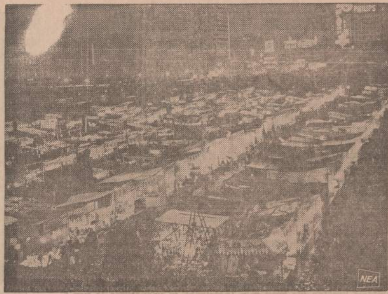
Prasitą savaitę kiniečiai šventė savo Naujuosius Metus. Paveiksle matome Naujų Metų vaizdą Hongkonge. Krautuvės ir kioskai buvo papuošti ankstyvomis gėlėmis. Kiekviena šventė kiniečiai parduoda daug gėlių. Jeigu dovanotos gėlės nenuvysta, tai skaitoma nepaprastai didelės laimės ženklui.

Susizinojau ir su 15-to wardo aldermonu Kruska. Jis sirguliuo, bet vis dėlto man prižadėjo, kad miesto taryboje nebalsuos už jokių nuostatų, kurie sumažintų vietos gyventojų nuosavybės vertę. Be to, aldermonai nori žinoti, kada ir kur jų apylinkėse planuojama statyti daugiaaukščiai namai. Būtinai gera, kad ir kiti mūsų laukia susizinojotų su savo aldermonais ir patartų jiems kreip-