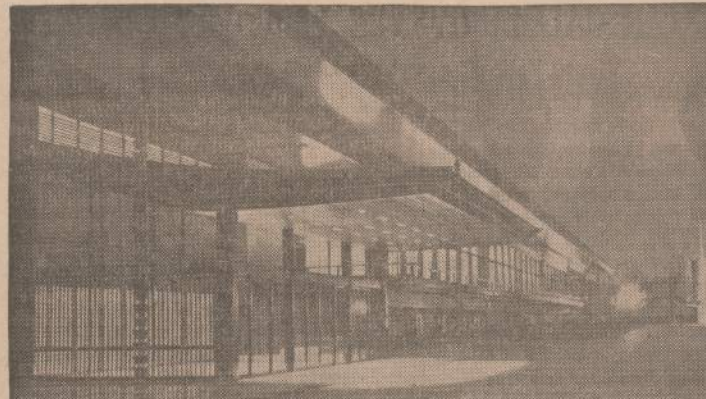
Naujai pastatyti Japonijos mikado rūmai. Architektai pagrindan dėjo pačias moderniausias statybos priemones, bet tuo pačiu metu paliko seną japonų architektūros stilių. Matome prievaziavimą prie modernių japonų karaliaus rūmų.