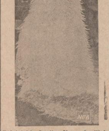
Dainininkė Sandie Shaw Anglijoje vadinama "paukštyte", dėl nepaprastai gražaus jos balsu. Londone teatre ji pasirodys pasidabinusi paukščio plunksnomis. Audėjui ir siuvėjui teko suverti 7,000 įvairaus dydžio plunksnų i "paukštutes" apsiaustę.

Bilietų kainos: Parteryje: 8, 6,50 ir 5 dol. Balkone: 7, 5 ir 3 dol. Premjerai — visi bilietai 1 dol. brangesni. Chicago Lietuvos Opera (Pr).