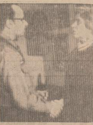
DVIEJŲ VADOVŲ SUSITIKIMAS PARODOJE