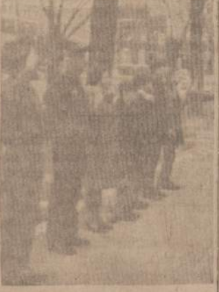
LIETUVOS VĒLIAVAI KYLANT PRIE KONSULATO

Nereikia net priminti, jog užperėitą sekmadienį šventėme Vasario Šešioliktąją, tačiau ne daugelis žino, kad tą dieną