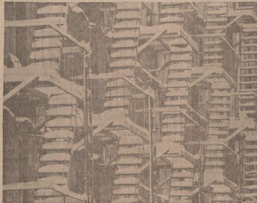
Kopėčios gelbėtis nuo gaisro gadina namo išvaizdą. Bet praėita savaitė, kai New Yorke gerokai pasnigo, ir apsnigo kopėčias, tai fotografui pavyko nutraukti šį gana įdomų žiemos architektūros vaizdą.

7909 STATE RD. OAK LAWN, ILL. Phone: 636-2329