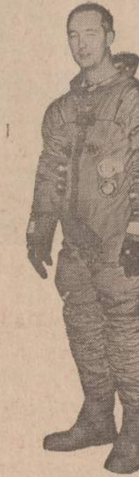
Astronautas McDivitt, jau skridęs apie žemę, ateinantis penktadienį bandys paskrajoti erdvėje vadinamoje Lunar Module. Jis turės atsipalaiduoti nuo Apolo 9-tojo, paskrajoti savo keliais, o vėliau vėl susijungti su Apolo 9-toju.

Diplomatiniai stebėtojai aiškina, kad sovietai nutarę negilti Berlyno krizės ir nedidinti įtempimo. Sovietams svarbu pradėti kalbą su nauju Amerikos prezidentu ir jie nemori sugadinti tiems pasitarimams reikalingos ramios atmosferos, o