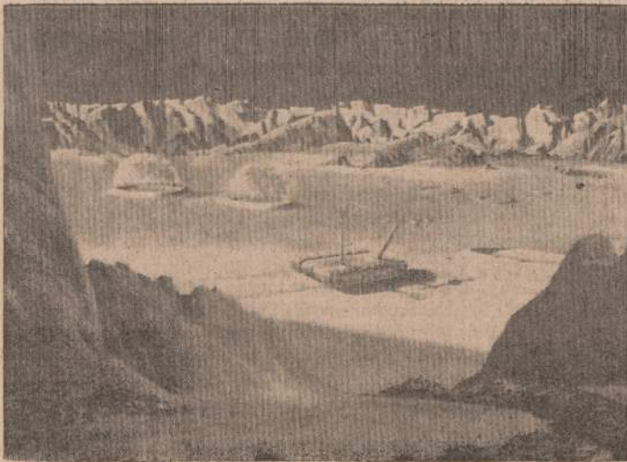
PIRMOJI ŽMONIŲ KOLONIJA MENULYJE

Nežiūrint, kad Mariner IV visą savo kelionę atliko tiksliausių tikslumu nepaskubindamas ir nesuvėluodamas nė minutėi, ir pro Marsą užpakalį turėjo praskristi per 52 minutes ir 32 sekundes, tačiau tas praskridimas jam truko 7 minutes ir 12.4 sekundžių ilgiau, bet kas įdomiausia, tai kad Marinerui IV vėl pradėjus transliuoti savo signalus, kurį laiką tomis pačiomis