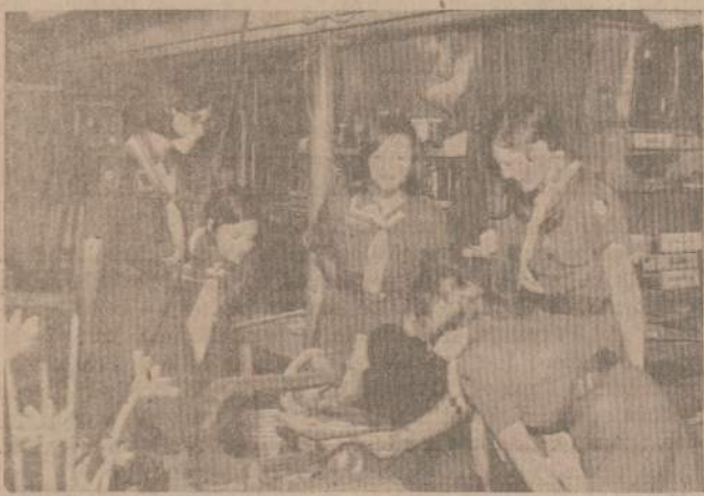
NETIKĖTAI UZSPRINGO SIUVAMOJI MAŠINA, BERUOŠIANT RANKDARBIOUS KAZIUKO MUGEI