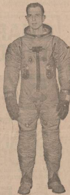
Penktadienį, vasario 28 dienos rytą, trys Amerikos astronautai pakils į erdvę, kad bandytų padaryti patį sunkiausią manevrą erdvoje. Jie atsiskirs, pasikraus savais keliais, o vėliau vėl susijungs ir nusileis. Pažvelksite matome astronautą Scott, kuris vadovaus penktadienio skridimams.

"NAUJIENAS" SKAITO VISŲ SROVIŲ ŽMONĖS: DARBININKAI, BIZNIERIAI, PROFESIONALAI, DVASININKAI, VALSTYBININKAI, MOKSLININKAI, JIE ŽINO, KAD "NAUJIENOS" PADUODA TEISINGIAUSIAS ZINIAS IR GERIAUSIUS RASTUS.