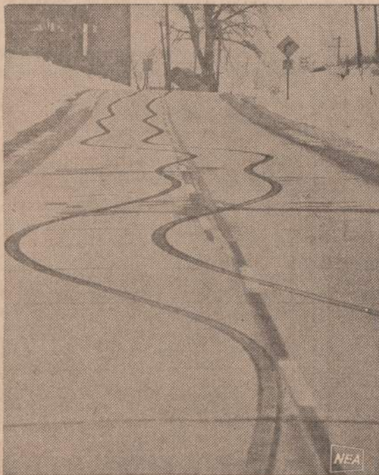
Vieno Lebanon, Wis., kaimelio gyventojų automobilis nenorėjo klauasyti. Tada rodo sniego paliktą pėdsaką. Jis manė, kad jau artėja nelaimė, bet vis dėlto jam pavyko mašiną suvaldyti.

— Balfo Chicagos apskrities valdyba praneša, kad kovo 9 d., sekmadienį, 4 val. po pietų,