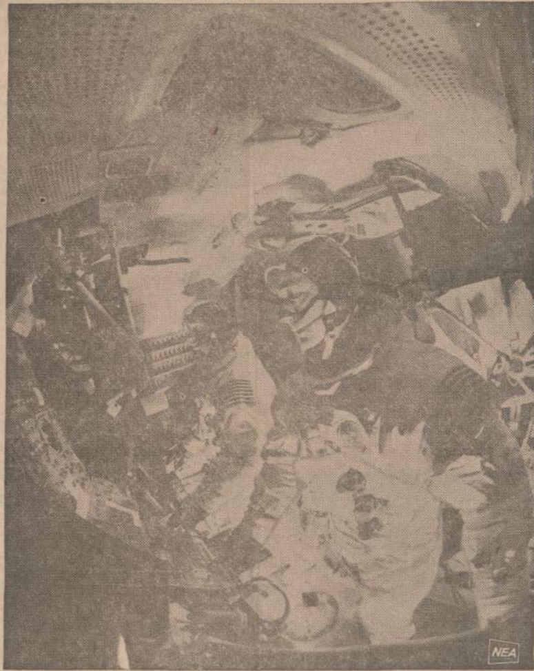
Astronautai James McDivitt ir Russell Schweickart susipažįsta su vadinamos Lunar Module mašinomis, kad galėtų valdyti, kai skris apie Žemę.

WEST POINT. — Buvęs valstybės sekretorius Ruskas gaus iš Amerikos karininkų sąjungos garbingą Sylvanus Thayer premiją, kuri duodama tik tiems, kurie pateisina savo darbu šūki: "Garbė, Pareiga, Tėvynė".