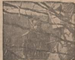
The Iron Curtain Isn't soundproof.