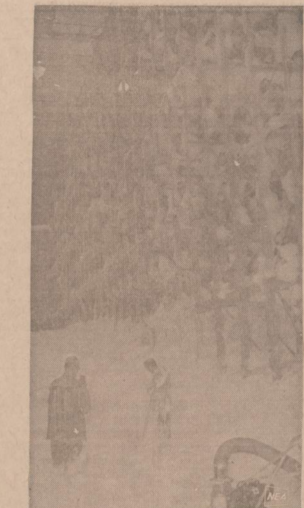
Vaidas panašus į pripuštą sniegą, įėjusį pro paliktas atdaras sandėlio duris. Bet čia ne sniegas. Tai specialiai putota medžiaga, kurią Fordas naudoja apsaugai nuo gaisrų. Į 7 minutes putomis buvo užgesintas gaisras".