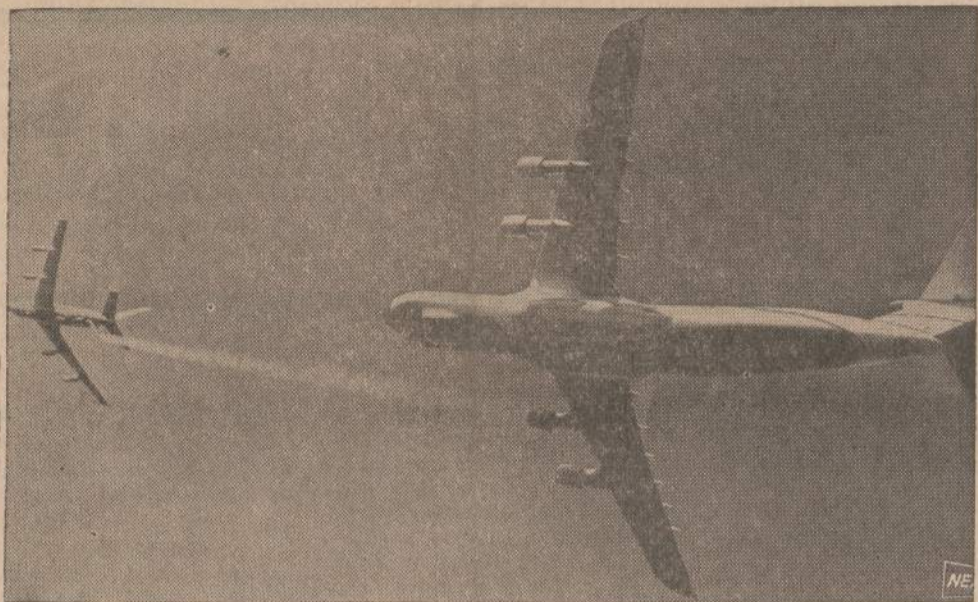
Didžiausias pasaulyje lėktuvas C-5 Galaxy. Keturiu sprausminiu motoru lėktuvas bandomas įvairiose skridimo sąlygose. Amerikos tankeris, panašus į nykštuką, skrenda priešakyje ir leidžia vandenį ant mišinio. Paleistas vanduo ledėja ir kerta mišinišką lėktuvą. Bandytas parodė, kad mišinys galėjo lengvai ledus atlaikyti. Mišinio bandys skristi į Pietų Ameriką ir į Aljaską, kad išbandytų visokiame ore.

rofono. Čia vienas, barzda apaugęs „taikos“ šalininkas, išvadino garbingus svečius rasistais ir pareiškė, kad Amerikos „Jėgos struktūra“ bus sugriauta ir užversta „ant jūsų ausų“. Furibgas daugiau ir nebandė kalbėti.