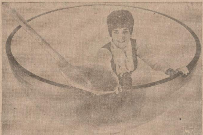
Atrodo, kad mergaitė yra įsilipusi į didelį dubenį, bet tikrovėje ji yra jūros gilumon leidžiamo laivo bokšte. Specialistai priėjo įsitikinimo, kad storas stiklas yra pakankamai atsparus vandeniui. Per stiklą mokslininkai galės stebėti jūros gilumos gyvenimą.