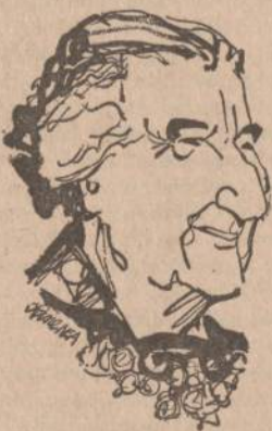
Buvusi Izraelio užsienio reikalų ministrė Golda Meir siūlo Izraelio premjero pareigoms.

Sirhan Sirhan teisme pareiškė, kad jis neatsimėnas, kaip ir kada jis nušovė senatorių Kennedį. Jis tą vakarą daug gerės ir neatsimėnas visų smulkmenų. Jis tik prisimena, kaip kažkas jį pačiuo už gerklės ir ėmė smaugti. Kad Kennedis miręs, jis sužinojęs tik kitą rytą.