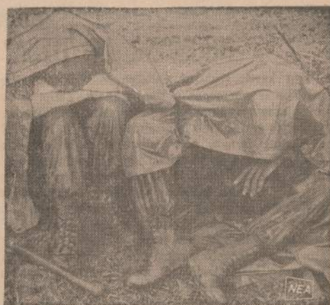
Paveiksle matome du Amerikos marinus, Batangan pusiasalyje apsi-dangęsius nuo smarkaus lietaus. Operacijų metu karali gerokai išvargo.

Labai populiarius būdas iškelti iš šios žemės operose yra nuodai. Juos išgėrusi, mat, solistė dar gali padainuoti kelias arijas. Scenoje niekas nežino (tik publika nujaucia), kad ji neužilgo mirs. Taip iškelti iš paskutinio akto Leonora iš "Trubadūro". Pamažu mirti, ar, kaip minėta, prieš mirštant dar padainuoti galima ir gyvam palaidotam, kaip Aidai su mylimu Radamesu. Yra ir visai originali atsisveikinimų su šiuo pasauliu: nušokti nuo pilies bokšto, kaip Florijai Toskai, arba būti pa-