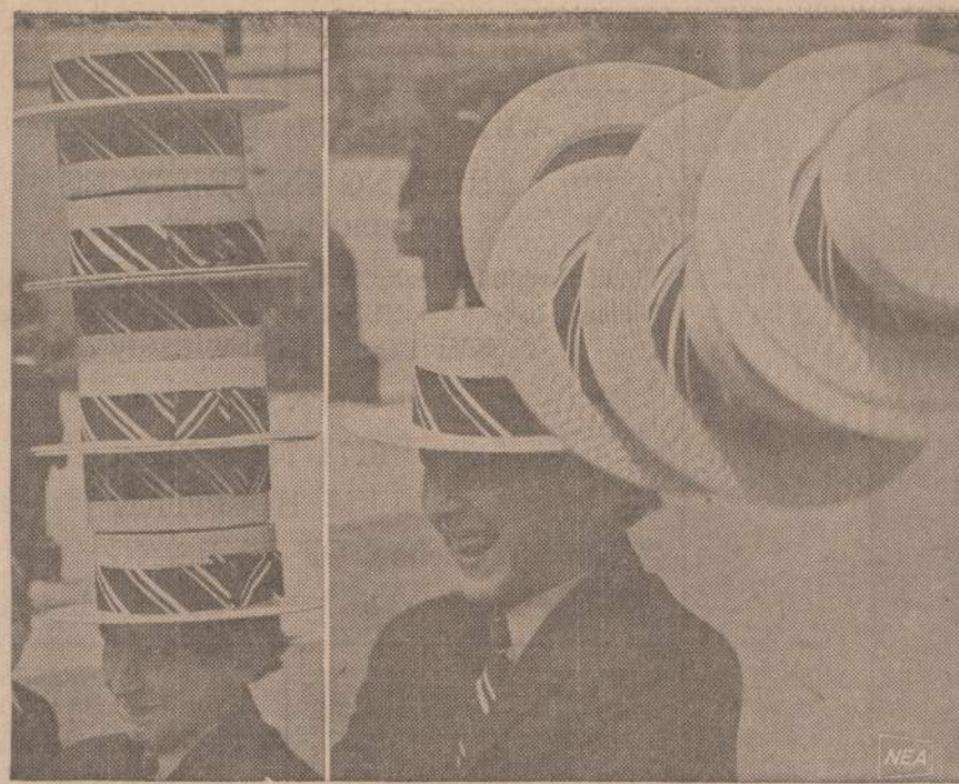
Atėinančiai vasarai Anglijai užsakė britams paveikslė matomas skrybėles. Pirkliai nori, kad kiekvienas anglas nusipirktų ne vieną, bet bent po penkis skrybėles.