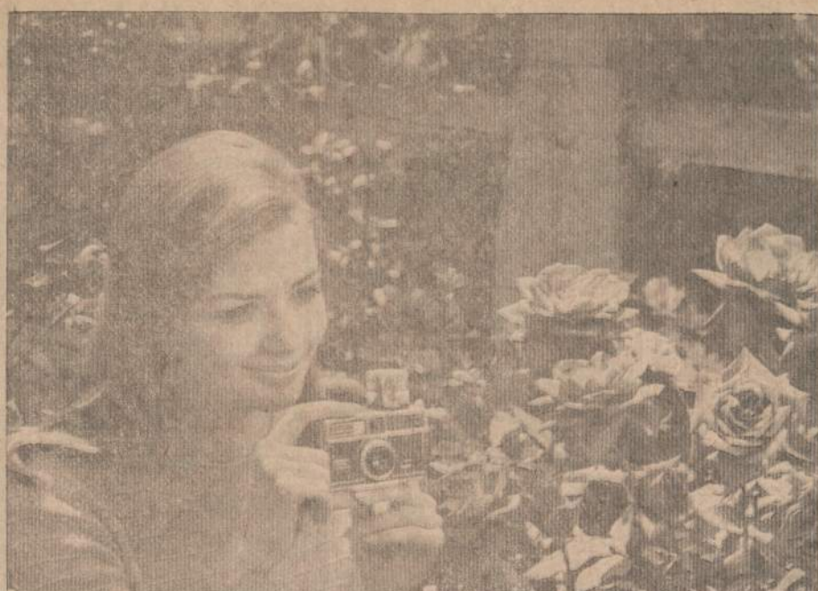
Ištisa savaitė nuo šeštadienio kovo 22 d. iki sekmadienio kovo 30 dienos imtinai Chicago's amfiteatre (International Amphitheatre) įvyks metinė Pasaulio Gėlių ir Daržų - sodų paroda. Apie ją jau buvo ir bus rašyta, bet niekas to negali aprašyti, ką pats gali pamatyti. Parodoje bus, kaip kiekvienais metais, tam tikras fotografavimams įrengtas Eastman Kodak Photo Garden, kur ir gėlių įvairumas bei gražumas, ir šviesos, ir čia pat visu fotografijai reikalingu dalyku gausus paviljonas, ir ekspertai patarėjai, kurie parodys ir pamokys kaip geriausiai daryti nuotraukas.