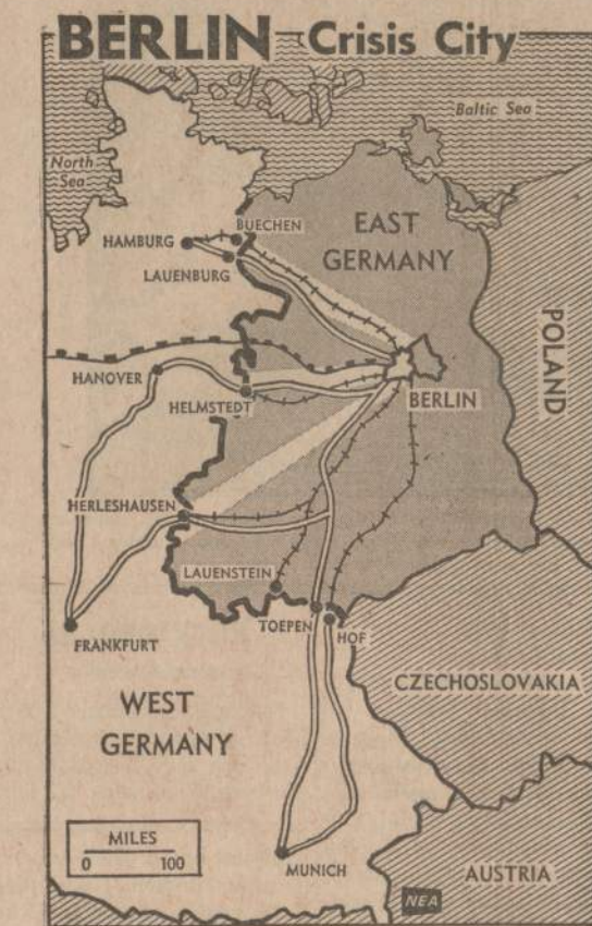
Berlynas labai dažnai sukelia įtampos tarp Vakarų sąjungininkų ir imperialistinės sovietų valdžios atstovų. Rusai ir komunistai bando trukdyti susisiekti tarp Berlyno ir Vakarų Vokietijos. Dabar paaiškėjo, kad karo metu pasirašytoji sutartis kalba tikrai apie amerikiečių, britų ir prancūzų teises susisiekti su Berlynu, bet ne vienu žodžiu neužsimenama apie pačių vokiečių teises pasiekti Berlyną.