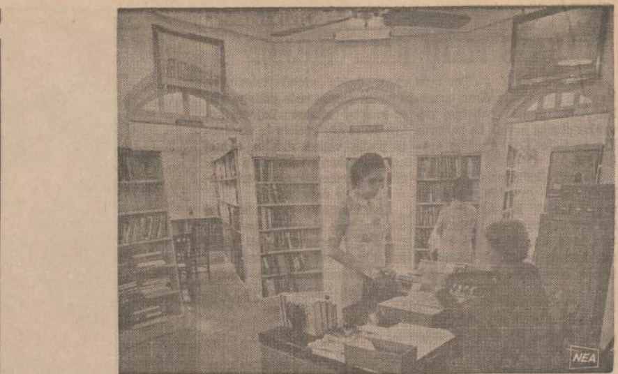
Praeitais šimtmečio pradžioje šioje salėje dar buvo teisiams pagauti piratai. Jūs laikė apacioje esančiuose tuneliuose, o teisė paveikslė matomoje salėje. Dabar šioje salėje yra didžiausias Neso miestelio knygynas.