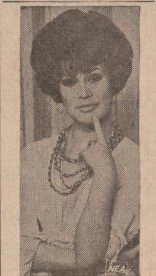
Rusų moterys atrodo labai jau nergrakščios, bet paveiksle matoma rusaitė gana gyva. Brangiame Maskvos restorane paveiksle matomoji dainuoja ir linksminasi sostinės suvažiavusių ir pavakarienių atėjusių sovietų valdžios atstovus.