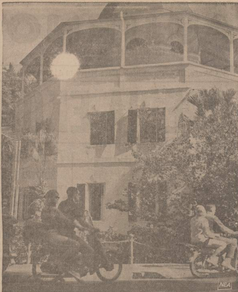
Iki 1873 metų šiame name buvo laikomi Bahamų vandenys pagauti svarbesni piratai. Šiandien buvęs kalėjimas paverstas salos knygynu. Turistai motociklais važinėja po salą ir užėina į skaityklą, kad pamatytų, kur senovėje buvo laikomi piratai.

Iš Union Pier Lietuvių Namų Savininkų Draugijos Valdybos ilgo kūrinio gaunamas įspūdis, kad arba jaučiasi turinti pasaulimą į mesianizmą ginti "placią lietuvių visuomenę", kurioje "Byleko ilgokas straipsnis" sukėlęs "ypatingo nepasitenkinimo ir nustebimo", arba kai kas Valdyboje mėgsta rašinėti. Nes Byleko korespondencijoje iš Union Pier du trečdaliai buvo lietuvių paežeriais įsikūrimo "istorija" ir tik vienas trečdalis apie nelemtą klubo ar draugijos susirinkimą, kur apie "žalėsa" ir "davatkas" pasakyta, kad jų Union Piere yra tik "nemaža