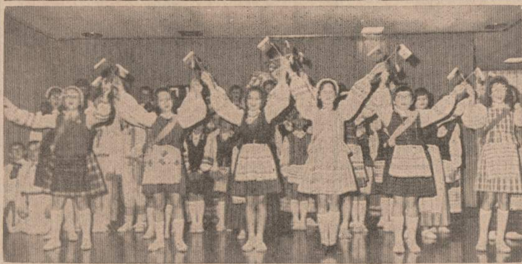
Brighton parko lietuaininė mokykla judesiuose išpildė "Stovių aš parimus" per LB Brighton Parko Vasario 16 minėjimą, kuris įvyko vasario 23 dieną.

Si Moterų kuopa atsiliepia į prašymus aukų šalpos ir kultūros reikalams. Siems prašymams patenkinti reikia išteklių, todėl kuopa rengia žaidimų popietę kovo 16 d. Hollywood svet., 2419 W. 43rd St.