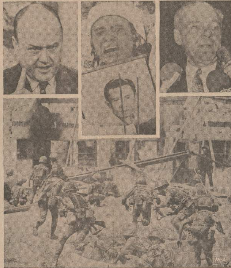
Nežiūrint į prezidento Nixono išpėjimą ir krašto apsaugos sekretoriaus Melvin Laird griežtus žodžius, komunistai apšaudė Saigono priemiestį. Paveikslas apacioje matome Vietnamo karių, puoliančių priemiestį priartėjusius komunistus. Taišios konferencijon suvažiavusiems delegatams išpėjimą padarė ambasadorius Cabot Lodge, bet komunistai nekrelpia į jo žodžius reikalingo dėmesio.

Sovietų žinių agentūra paskelbė, kad įvyko naujas incidentas Kinijos-Mongolijos pasienyje. Kinai suėmė nenustatytą skaičių mongolų geležinkelio darbininkų ir juos pagrobė — nusigabeno į savo pusę ir išlaikė aštuonias valandas. Mongolijos valdžia įtelkusi Kinijai protestą.