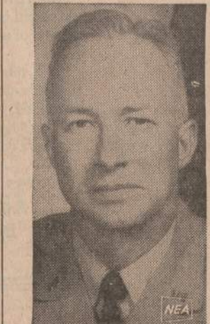
Prezidentas Nixonas gen. Andrew J. Goodpaster paskyrė JAV karo jėgų viršininku Europoje. Gen Goodpaster dabartinis metu yra Vietnamo esančių Amerikos dalinių karo vado vadovotojas.

TEL AVIVAS. — Izraelio kovos lėktuvai įskrido 20 mylių į Jordano teritoriją ir ten bombardavo tris arabų partizanų stovyklas. Gazoje sprogo arabų mokykloje granata. Buvo sužeista 18 mokinių, du jų sunkiai. NEW YORKAS. — Meksikos įlankoje, mašinų skyriuje įvykus sproginimui, nuskendo Libėrijos laivas.