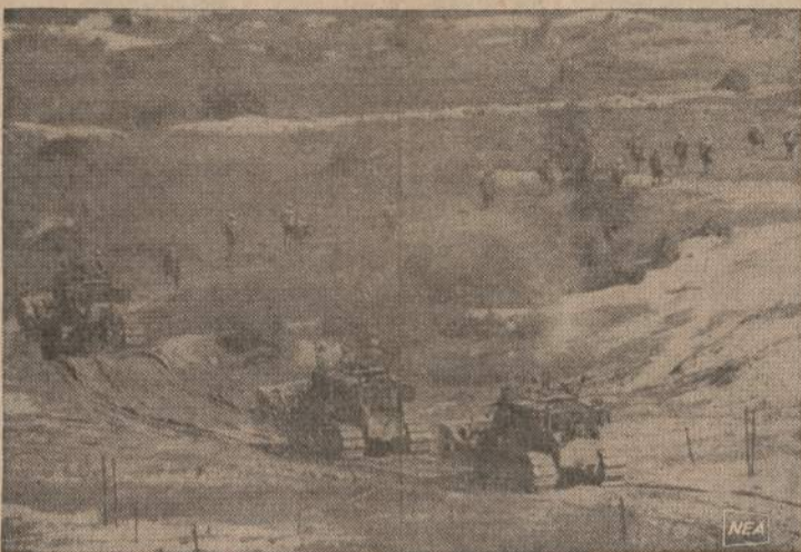
Pietų Korėjoje JAV kariuomenės buldozeriai seka kariuomenės dalinius. Nanevru metu Amerikos aviacija sunaikina „prieš dalinius“, o buldozeriai suligins aviacijos bombų išverstas duobes.

PRAGA. — Komunistų „Rude Pravo“ čekoslovakijoje reikalauja naujų parlamento ir partijos rinkimų. Tautinė asamblėja paskutinį kartą rinkta 1964 metais. Rinkimai sustiprintų valstybę ir partiją. Jie buvo atidėti, rusams reikalaujant, nes jie bijojo dar didesnio liberalų komunistų sustiprėjimo.