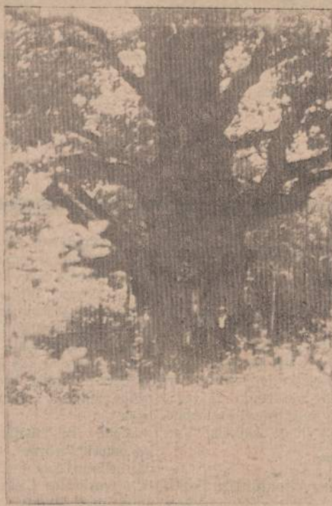
Stelmužės ažuolas, kuriam apkabinti yra reikalingi 27 aukštaičiai.