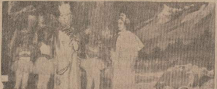
Tų rūbų žavumas, tu dail. J. Kiburo dekoracijų gražumas — vis tai tie ir dar kitokie geri dalykai į grožį ir gerį nuotėks visus Alvuodo Vaiku Teatro vaidinime "Du Broliukai", kai 35 aktorai vaikai kalbės eilute kalba saviesiems šį sekmadienį, kovo 23 d. Jaunimo Centre. Nuotrauka inž. Ks. Kauno