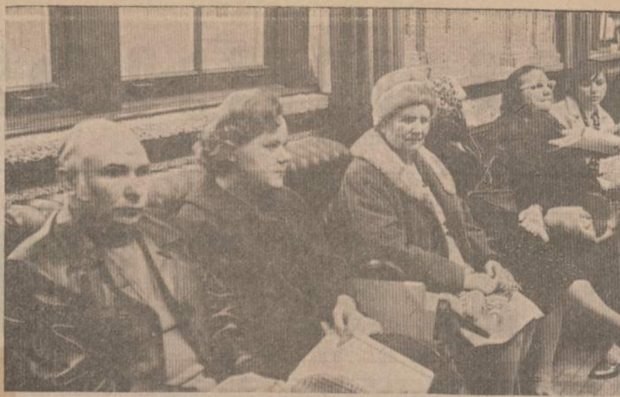
Vyresnieji Alvuodo mokiniai — tėvai.