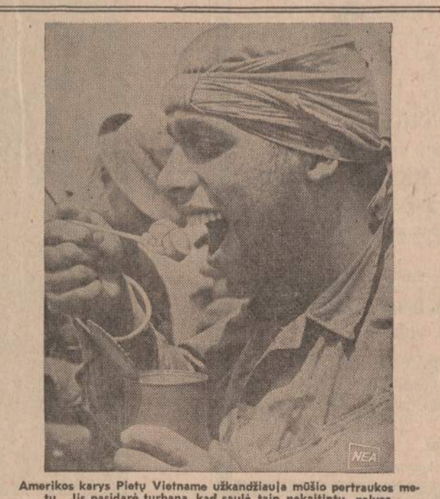
Amerikos karys Pietų Vietname užkandžiauja mūšio pertraukos metu. Jis pasidarė turbana, kad saulė taip nekaitintų galvos.