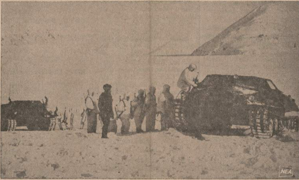
Sovietų kariai rodo Azijos gyventojams, kaip vartoti galingus tankus. Maskva įsakė sustiprinti visą Sibiro pasienį. Paveikslė matome sovietų tankus, esančius Magadabo srityje.

Šitokiose sąlygose Amerikos naujas ambasadorius Indijos turės nelengvą uždavinį, nes premjerė Gandhi, atrodo, linkusi nematyti sovietų klastos ir užmačių.