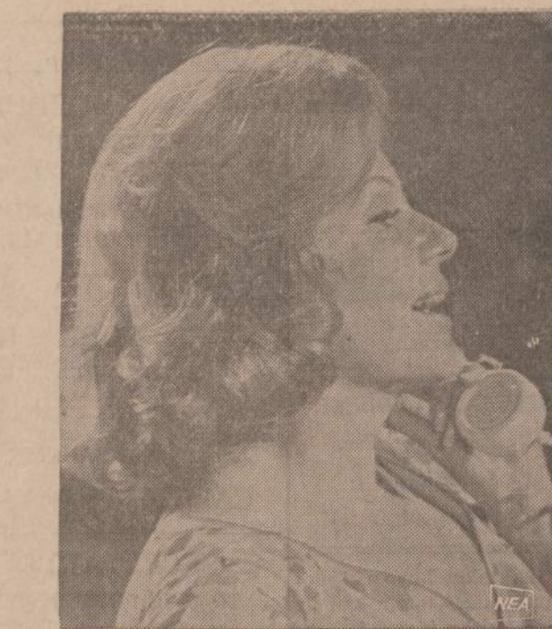
Kino artistė Rita Hayworth, kurį laiką nevaidynusi, dabar suka naują filmą, kuriame bando įtikinti jauną rašytoją užleisti j namus ir gražiai praleisti vakarą. Artistė jau persirio 50 metų.