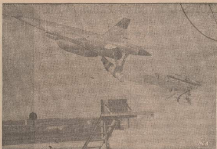
Falifornijoje, Point Mugu srityje, Amerikos laivyno centre, sprausminis lėktuvas naudoja galinę prietaisą raketoms leisti. Laivyno specialistai šiuos bandymus veda ištisus metus.