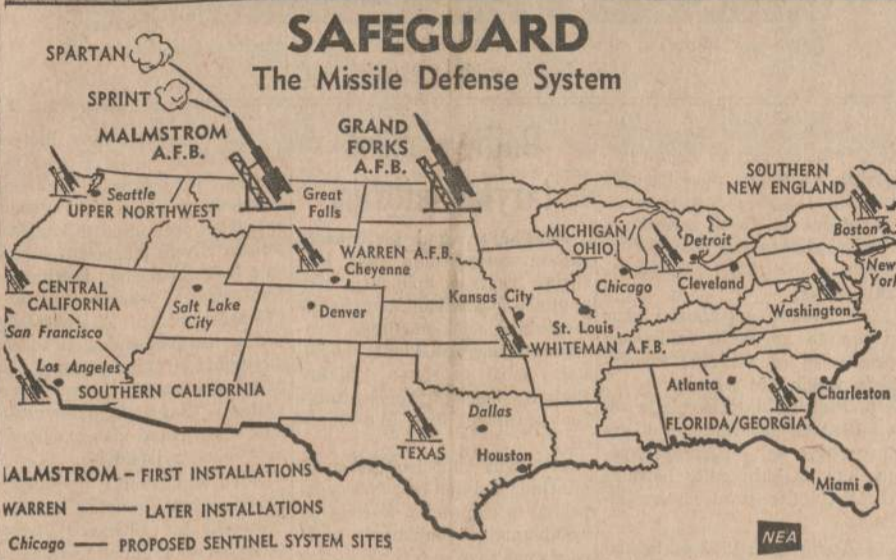
Prezidentas Nixonas prašo kongresą skirti pinigų strateginėms Amerikos sritims apsaugoti. Prezidentas nemanoma, kad galima būtų apsaugoti kiekvieną didmiestį, bet jis yra įsitikinęs, kad galima apginti strategines vietas. Kongreso atstovai svarsto prezidento prašymą ir krašto apsaugos sekretoriaus pareiškimus.

Vokiečiai tą slaptą susitarimą ne perdavę slėpė. Tiesa, savo laiku apie jį niekas nieko nesužinojo tarp lietuvių, bet vokiečių pareigūnai net ir Kaune buvo šiek tiek apšviesti. Bent jau tada, kai Maskva pateikė Lietuvai ultimatumą, vienas vokiečių spaudos atstovas Kaune prasiarė, kad norintieji išvengtų bolševikų, gali — užteks tik persikelti, pavyzdžiui, kad ir į Aleksotą. — Kauno priemiestį kitoj pusėj Nemuno. Bet rusų kariuomenė, įsiveržusi į Lietuvą, kažkaip "užmiršo" apie susitarimą "įstaisyti sieną", ir užėmė visą Lietuvą, o paskui vėl ėmė su vokiečiais derėtis. (E)