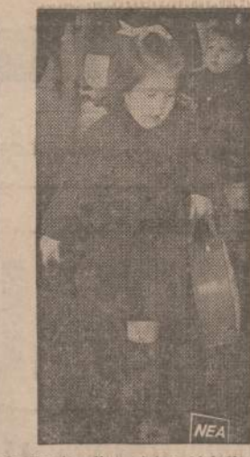
Graikų karaliaus duklė Aleksija skuba į aerodromą, kad su motina galėtų nusikristi į Olandiją. Graikų karalius dabar gyvena Italijoje, bet kartas nuo karto jis išskrenda į kitas valstybes. Graikų generolai dar nenori karaliaus išleisti į Graikiją.

BIZNIERIAI, KURIE GARSINASI "NAUJIENOS" — TURI GERIAUSIAI PANISKIAMA BIZNYK — TAD GARSINKIS IR TU