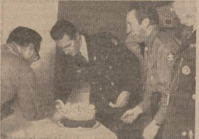
UŽSIDĖGA 47 ŽVAKUTES ANT GIMTADIENIO PYRAGO