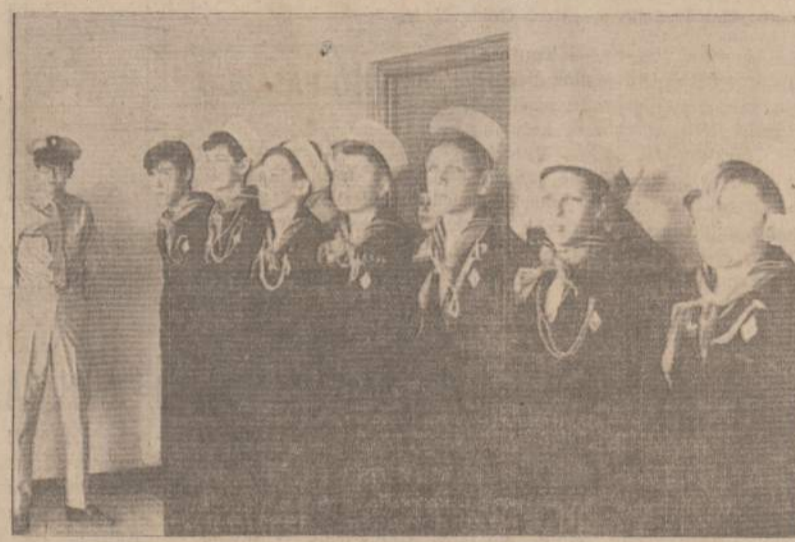
ISKILMINGOJE JŪRŲ SKAUTŲ GIMTADIENIO SUEIGOJE KOVO 16 D. Dalis LK Algimanto laivo jūrų skautų oficialioje programoje Jaunimo Centre.

ky pakirsti. Ten buvęs mis, padainavo "Lietuva brangi, mano tėvyne"... Kaip pabaigai sudainuotos dainos taip ir kiti momentai priminė patriotam džiaugsmą ir liūdesį, kurį ypač jautriai pergyveno 1917—1919 m. lietuviškų organizacijų nariai bei L. nepriklausomybės kovų dalyviai — Lietuvos priešų kul-