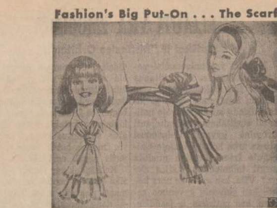
Fashion's Big Put-On . . . The Scarf

Istatymų leidimas priklausė karaliui, senatui ir pavietų bajorų atstovams, kurie sudarė vieną bendrą abiem valstybėm seimą, posėdžiaujantį Lenkijoje. Senatas buvo sudarytas iš aukštųjų bajorų luomo narių ir aukštųjų dvasininkų. Pavietų bajorų atstovai buvo taip pat renkami pavietuose iš įtakingųjų bajorų tarpo. Tad seimas buvo bajorų luomo atstovybė,