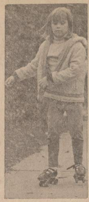
Ziema čiuožtuvai, o pavasarį ratukai. Šaligatvis gali būti sklytas, bet sky-lės nesulaiko jaunų sportininkų.