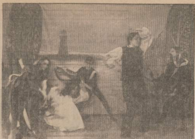
ISKARPA IS LIETUVIŲ TELEVIZIJOS PROGRAMOS

Chicago "Nidos" laivo jūrų skautės šoka "Jūratė ir Kastytė" Lietuvių Televizijoje sausio 19 dieną.