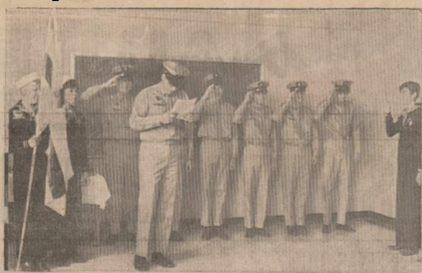
ISAKYMU MOMENTAS ŠVENTINEJE SUEIGOJE

Gaila, kad jūrų skautų-čių tėvelių dalyvavimas šioje jūrų skautų gimtadienio sueigoje buvo negausus. Dalyvis