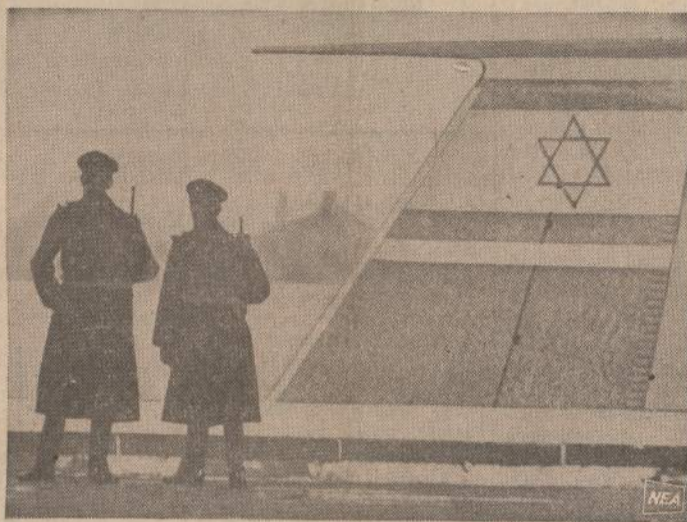
Arabai jau apiaudė kelis Izraelio keleivinius lėktuvus. Europos valstybės dabar saugo atskridusius Izraelio lėktuvus. Paveiksle matome du olandų policininkus, stovinčius prie Izraelio lėktuvo, atskridusio į Amsterdamą.

Jis ją grąžino 1956 metais, kai sovietų tankai sutriuškino Vengrijos laisvės sukilimą. Nuo to laiko jis pasuko daugiau į dešinę.