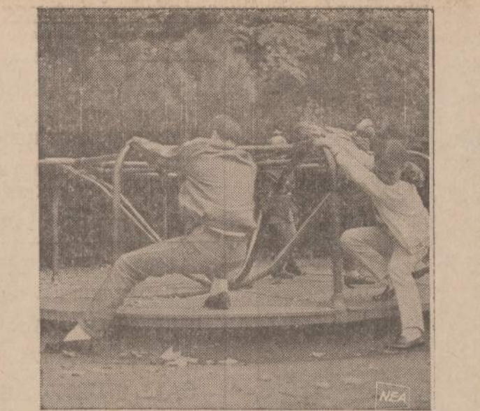
Pavasari labiausiai batūs piėšo jaunuoliai. Jie mėgsta sukintėtis, bet labai dažnai naujus batūs vartoja rafams stabdyti.

3 easy ways to get the Zip Codes of people you write to: 1 When you receive a letter, note the Zip in the return address and add it to your address book. 2 Call your local Post Office or see their National Zip Directory. 3 Local Zips can be found on the Zip Map in the business pages of your phone book. Published as a public service in cooperation with The Advertising Council.