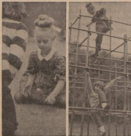
Vos atšilo oras, tai vaikai jau eina į parkus. Paveikls matome berniukus ir mergaites, žaidžiančius šiltesniuose parkuose.

Istaigos pietuose kiemas automobiliams pastatytį