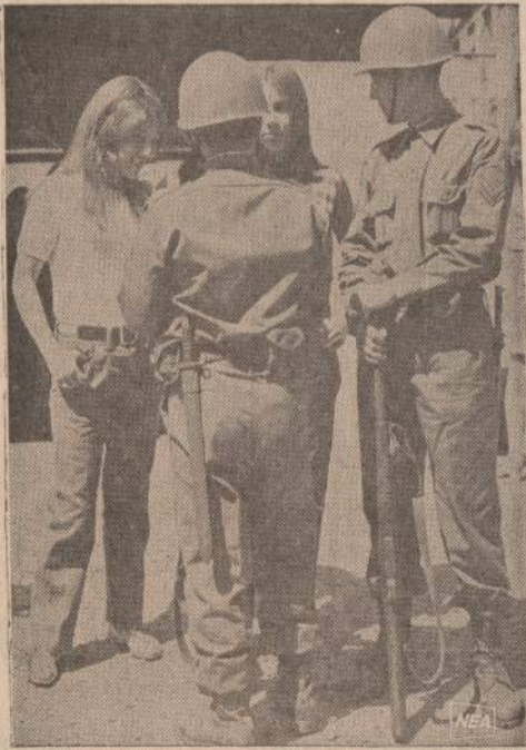
Visame pasaulyje mergaitės įvairi gerai apsidėžiusiais jaunais karaliais. Paveiksle matome dvi žiūlėtas, besikalbančias su kareiviais, saugojančias rinkimų tvarką ir rimti.

ALŽIRAS. — Karinis teismas pradėjo svarstyti 56 alžiriečių bylą. Jie kaltinami smokslu nuversti vyriausybę. Septyni kaltinamieji teisiami už akių. Jie gyvena Prancūzijoje.