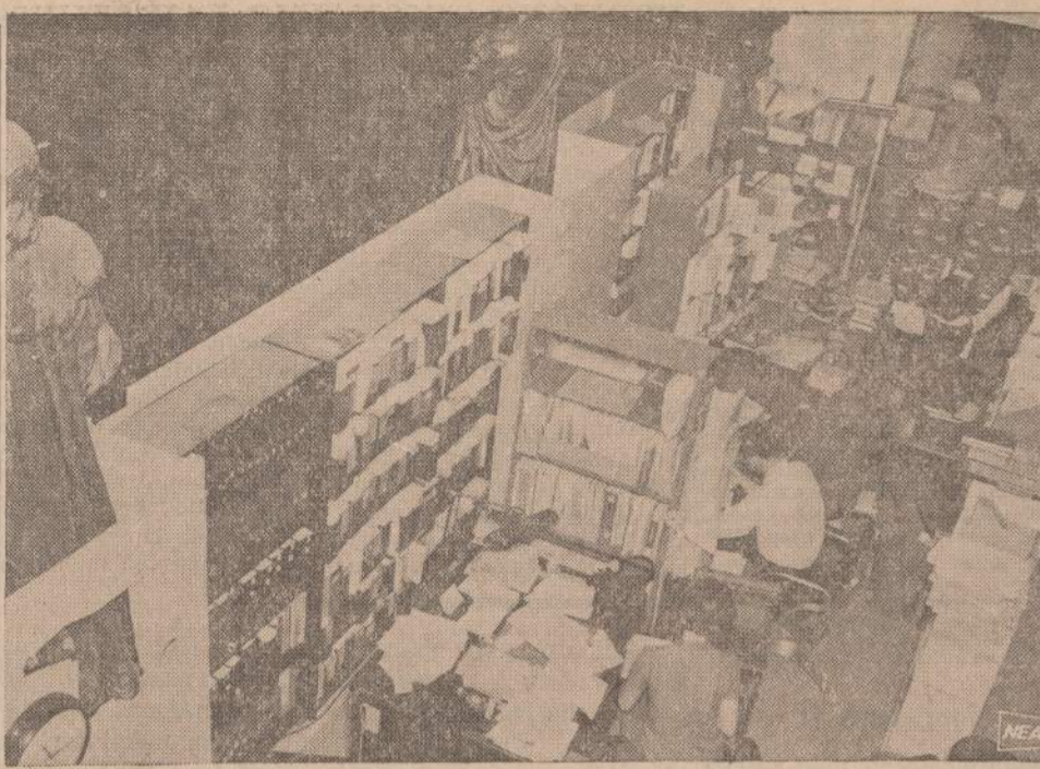
Daugelis mano, kad JAV kongreso knygynas yra geriausiai organizuotas. Taip buvo anksčiau, bet šiandien knyga skaičius toks didelis, kad nebetepla buvusiose patalpose. Paveikslė matome susigrūdusią kongreso knygyno dalį.

Na, su "Dana" tai ten tikrai niekas mūsų neįsileistų, nes čia yra ir Lietuvos buvęs karis ir partizanų vadas ir stovykla. Iš ten kokį nors folklorinį ar istorinį kūrinių, gal, su laiku ir būtų galima bandyti čia pastatyti. Kiek žinau, nei "Pilėnai" nei "Vaivos juosta" nėra jau tokie geri. Labai daug jų muzikoje dunojevskiškos, dzeržinskiškos dvasios. Išskyrus vieną — kitą ariją nieko ten lietuviško nėra. Užuot svaiojus apie okupuotos Lietuvos kompozitorius, mums turėtų būti svarbu "išnaudoti", jei taip galima išsireikšti, mūsų čia gyvenančius kompozitorius, kol dar jie sveiki ir pajėgūs kurti. Reikia sudaryti są-