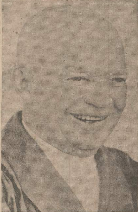
Generolas DWIGHT D. EISENHOWER, 34-ias JAV prezidentas, gimė 1890 m. spalio mėn. 14 d. Mirė 1969 m. kovo 28 diena.

Britų premjeras bandys paveikti Nigerijos valdžią, kad ji sušvelnintų savo puolimus Biafros sukilėlių miestuose. Dabar vakarų spauda pilna pranešimų apie žiaurius nekaltų civilių bombardavimus, turgaviečių ir ligoninių puolimus. Kitas daiktas, kuris rūpi britams, yra vis didėjanti sovietų įtaka Nigerijoje. Sovietai siunčia Ni-