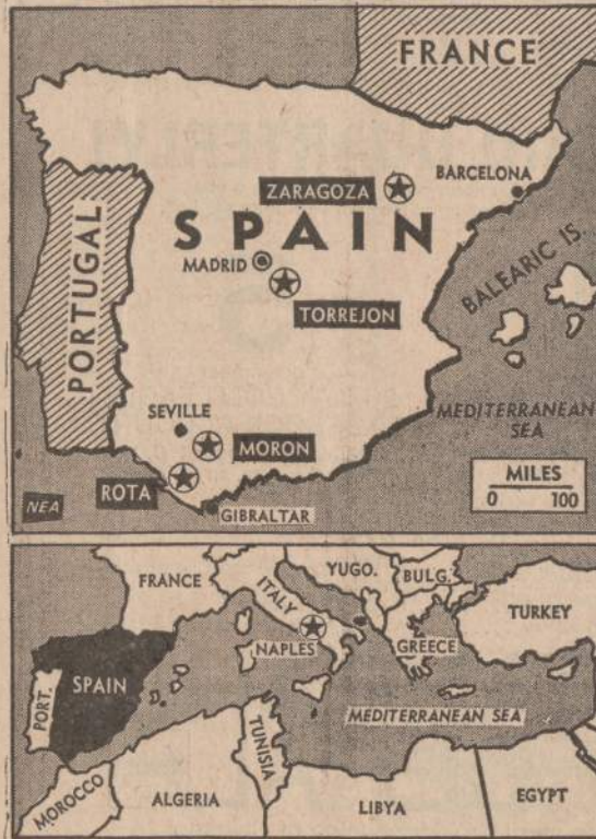
Ispanijos diktatorius Franko pareikalavo nepaprastai didelės sumos už leidimą amerikiečiams turėti savo laivyno ir aviacijos bazes Rotoj, Torrejon, Zarahozoje ir Moron miesteliuose. Franko norėjo bilijono dolerių, bet amerikiečiams nesutikus tokios sumos mokėti, diktatorius sutiko nusileisti. Prezidentas Nixonas nenori duoti daugiau 150 milijonų dolerių. Tieslamos derybos. Tvirtiausia JAV karo bazė dabar yra Napolyje.