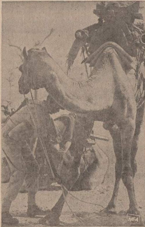
Suptykė kupranugariai yra pavojingi, bet Indijos kariai juos prapranta nešti du karis, kulkosvaidi, mortarą, amunicijos, maisto ir vandens visai savatei. Paveiksle matome apkrautą ir kallonel pasirošusį karį.

KARACHI. — Pakistane buvo suimtas eilė darbininkų unijų veikėjų, kurie organizavo streikus ir neklaušė karinės valdžios dekretų.