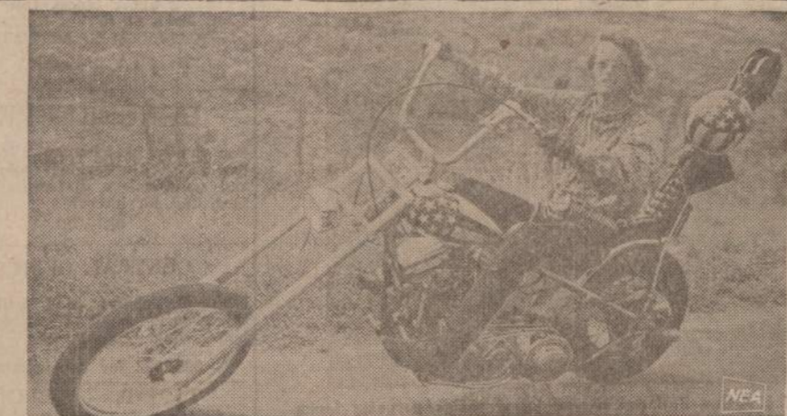
Kino artistas Peter Fonda važiuoja specialiai jam pastatytu motociklu. Kartu su kitu jaunuoliu jis filme apvažiuoja visą Ameriką.