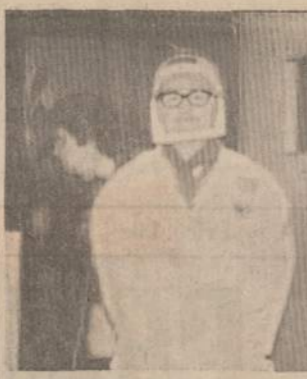
SU ASTRONAUTO DRABUŽIAIS

tausko (kuri lituanistinė mokykla jo nepažįsta?), visus me-