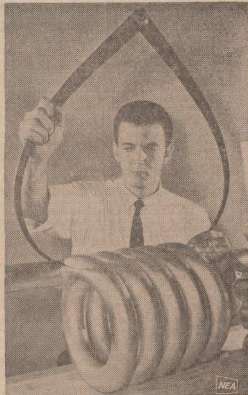
Plienui gaminti ir sukliki reikalingos nepaprastai stiprios ir tikslios spyruoklės. Inžinierius matuoja naujai pagamintą spyruoklę, kuri lenks iki 2,500 laipsnių įkaitusį plieną.