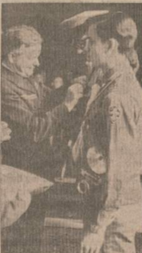
JAUTRI AKIMIRKA LITUANICOS TUNTE

Skautų organizacijos dirba- mas darbas pats už save kalba. Jau kelintame kultūros kongre- se ir Lietuvių Bendruomenės suvažiavime pasiskundžiama blogu lietuviškos spaudos plati- nimo tinklu, priimamos rezolu- cijos jį plėsti, organizuoti, kad knyga lengviau skaitytojų pa- siektų. Rezolucijos lieka popie- riuje, o platintojų tinklas ne tik nedidėja, bet jau ir mažėja. Ši- tokios mintys kilo po Kaziuko mugės apžiūros. Jos naudą pa- juto patys lankytojai, o gautu- ju iš tos prekybos pelnu džiau- giasi mugės rengėjai, kuriuo bus įgalinama tolimesnė skautų organizacijos veikla, ugdant ir auklėjant priaugantį lietuvių tautos jaunąjį atžalyną. J. Bubelis