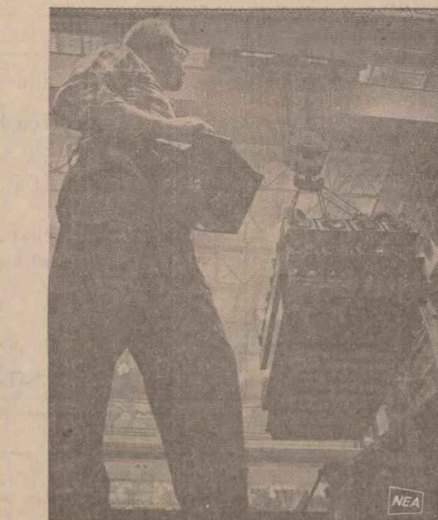
Massachusetts valstijoje, Pittsfieldo miestelyje yra didelės elektros transformatorių dirbtuvės. Paveiksle elektroniniu būdu kontroliuojama mašina pakelia 480,000 svarų svėrinį generatorių ir užveda jį ant sunkvežimio platformos.

... Netaikome daugiau boikoto, bet statome reikalavimus. Paprastai įeiname į kambarį mokyklos vedėjo, ar mokytojo ar kurio kito, kurių norime nusikratyti ir duodame jiems 24 valandas laiko išsikraustyti. Pritaikėme šį metodą prieš 10 ar daugiau mokyk-