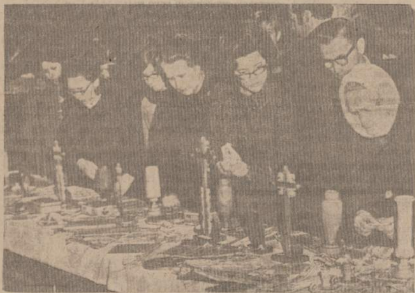
PRIE PHILADELPHIJOS KAZIUKO MUGĖS-PREKYSTALIO.

skautų ir skautėlių rankų darbai patraukia ir jaunųjų ir vyresniųjų dėmesį.