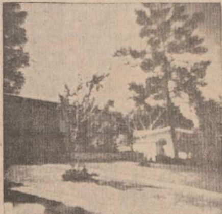
Jesėnų namai: saulėtas kiemas ir šešėlyje likusi rezidencija.

Viena visiems bendra lietuvių savybė (Laiškai iš "Mažosios Orbitos")