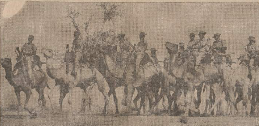
Indijos kupranugarų dalinys patuliuoja pasienį su Pakistanu. Kupranugariai gali nešėti kareivį ir našta 80 mylių į dieną. Jeigu yra reikalo, tai kupranugaris gali nešėti 10 mylių į valandą. Jam reikia daugiau vandens, negu žmonės mano.

Lebane kalbama, kad Sirijoje buvo susitarta tik todėl, kad nei vienas partijos sparnas neturėjo pakankamai jėgos išmesti kitą sparną, todėl buvo prieita kompromiso.