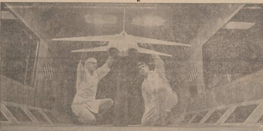
Ohio valstijoje, Columbus mieste Rockwell aviacijos bendrovė bando greičiau už garą skrendančius lėktuvus. Du inžinieriai nori nustatyti, kaip veikia lėktuvą 2000 mylių greičiu paleistas vėjas.