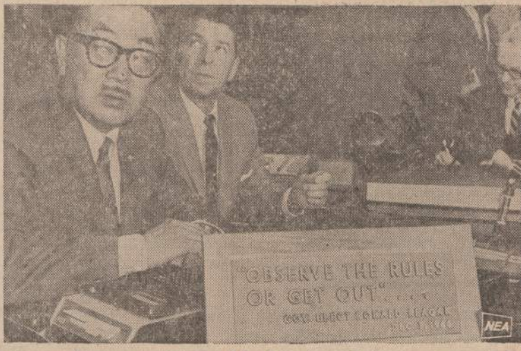
San Francisco kolegijos pirmininkas prof. Sam I. Hayakava ir Kalifornijos gubernatorius R. Reagan. Gubernatorius patarė universiteto vadovybei išmesti tuos studentus, kurie nesilaiko nustatytų taisyklių ir naikina mokslo įstaigos turta.

vo kasmet, o vėliau kas du metai. Neminėsiu valdybos narių, direktorių skyrių ir visų darbininkų sunkumų ir pasiaukojimo labdaros darbe, nes tai užimtų per daug laiko nušviesti. Be to, jau yra nemažai aprašyta knygoje Bolfo pirmieji dešimt metų 135 psl., mano išleistoje knygoje Atsiminimai 404 psl. ir dar bus šiais metais numatomoje išleisti naujoje knygoje minint Bolfo 25 metų sukaktį. Šiame jubiliejiniame Seime norėčiau iškelti mūsų laikų aktualias problemas.