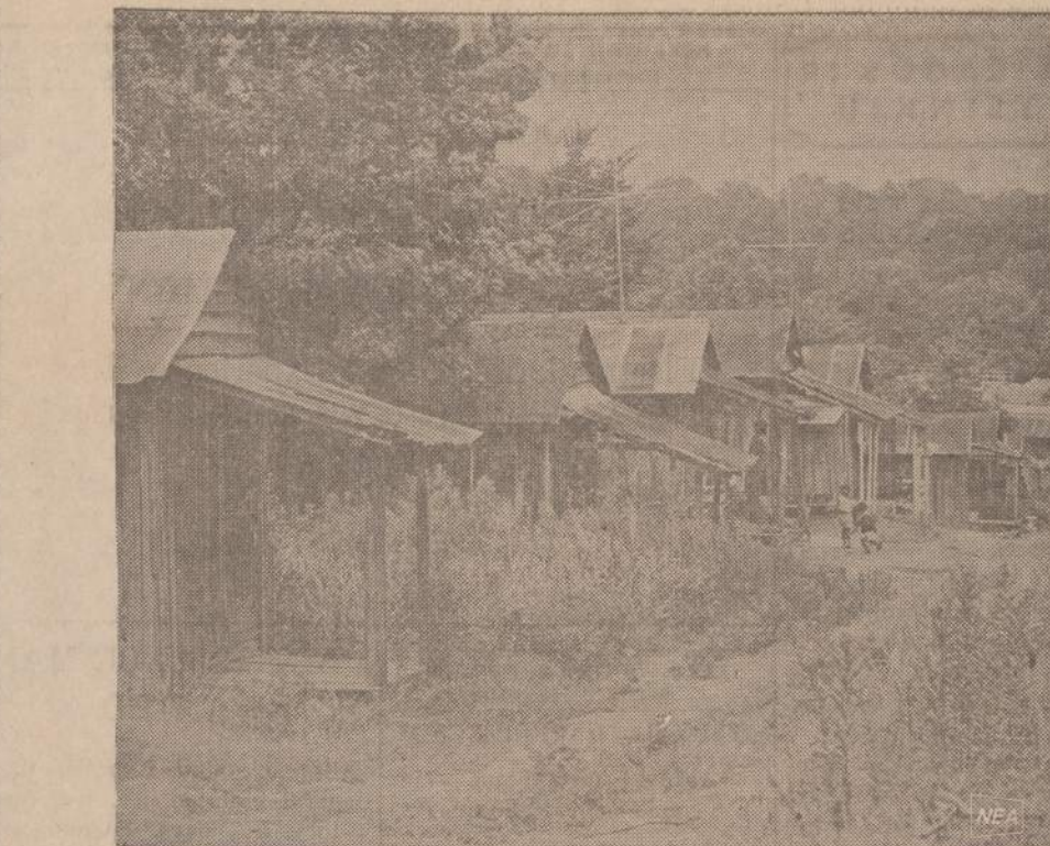
Amerikijoje pastatyti aukščiausi dangoraižiai, bet čia yra ir lūšnų. Paveiksle matoma Missouri Valstijoje stūkšančias lūšnas, kuriose dar tebevyvena žmonės. Jaunimas bėga į didesnius miestus ir mokosi amatų, bet vyresnieji baigia dienas savo lūšnose.

The Peace Corps Agricultural Desk Washington, D.C. 20525 Please send me information. Please send me an application. Name _____ Address _____ City _____ State _____ Zip Code _____ Advertising contributed for the public good.