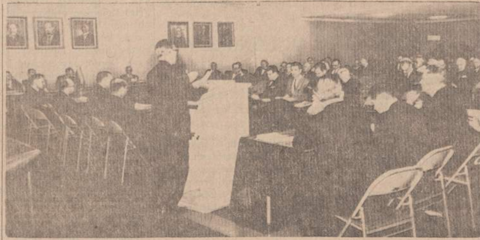
Lietuvių Fondo narių suvažiavimas 3. 29. 1969 m. Jaunimo Centre.

Pagal užsienio turistinių agen- tūrų ir jugoslavų turistinių at- stovybių informacijas, šįmet su- sidomėjimas apsilankyti Jugos- lavijoje, o ypač jos pajūryje —