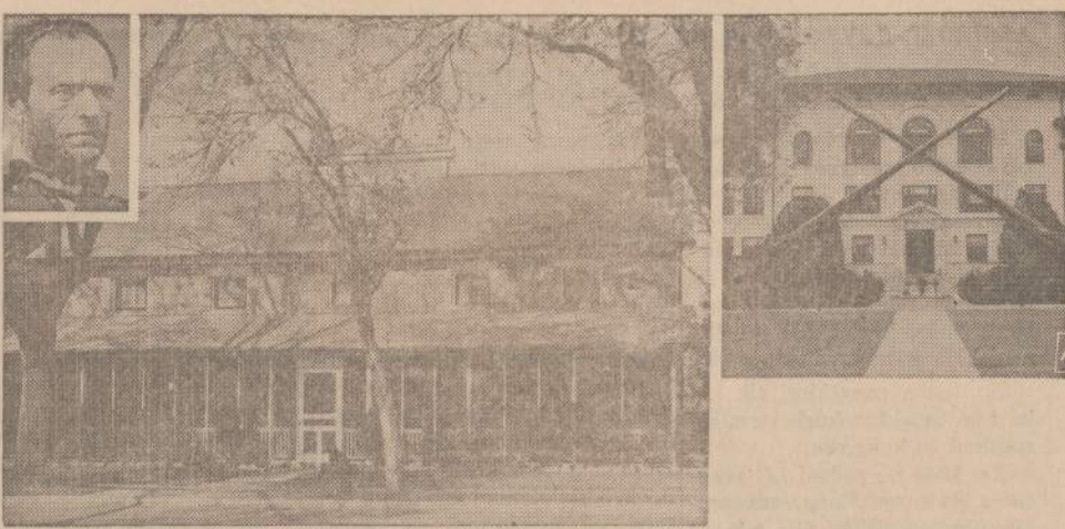
Kairėje viršuje matome gen. Shermaną, kuris buvo pirmas Oklahomoje esančio Ft. Sill viršininkas. Kairėje matome pirmą Ft. Sill namą, statytą prieš šimtą metų. Šiame name gyveno gen. Sherman su šeima. To meto indėnai neenuždė gen. Shermano, užuolus be sargybu palikta namą. Dešinėje matome dabartinį Ft. Sill komendantūrą. Priešakyje matosi sukryžiuotos kanuolės. Ft. Sill šiandien yra pats didžiausias Amerikos artilerijos centras.