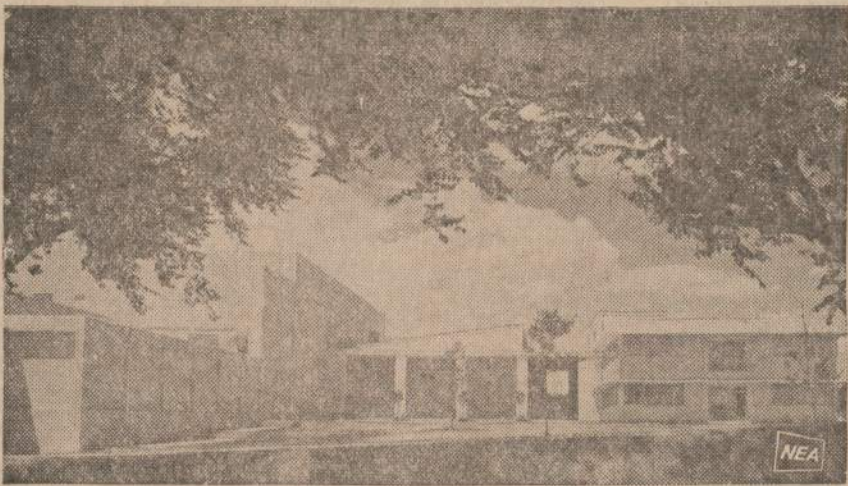
Dabartinis Ft. Sill lauko artilerijos štabas. Oklahomoje išbandomi patys moderniausi artilerijos pabūkiai.