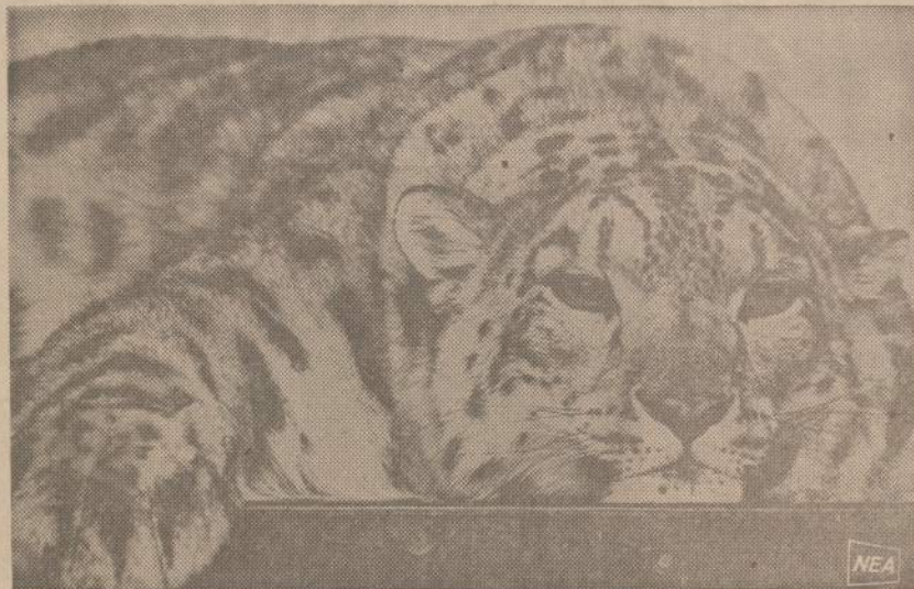
Sibiro miškų liūtas pradėjo nuobodžiauti Suomijos zoologijos sode.

Šiandien ir pats Vlikas, o ypač Vliką remianti visuomenė pagrįstai pasigenda vieno ir labai svarbaus dalyko: pasigenda suformuluotų Lietuvos laisvinimo ilgesniam atstumi gairių planingai ir efektingai kovai vesti. Šiuo reikalu daug esu galvojęs, iš savo patyrimo pozityvius gairėms faktus rinkęs, tačiau nei aš asmeniškai,