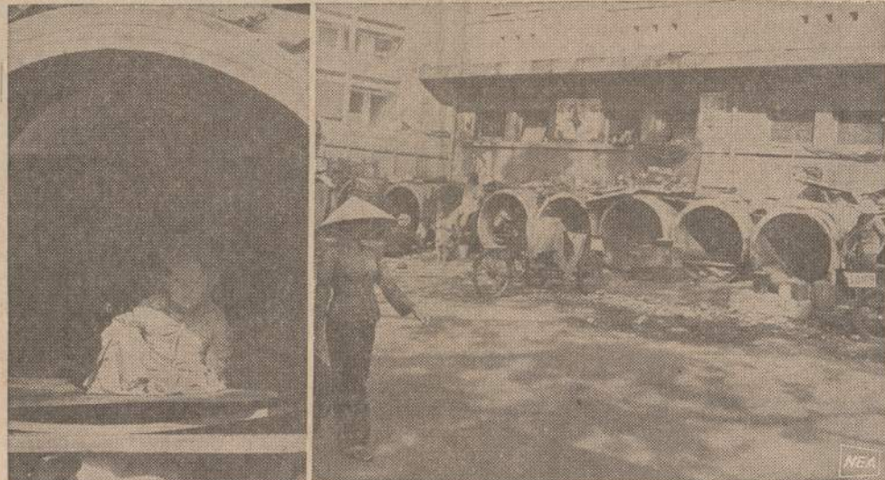
Komunistams išgriovus didoką namų skaičių Saigono priemiestyje Cholon, žmonės naktynės ieško dideliuose vandens nutekėjimo vamzdžiuose. Į vamzdžius lenda ne tik vaikai, bet ir šunys.

vynas susideda iš vieno seno lėktuvnešio, trijų kreiserių, kelių naikintuvų, frigatų ir mažesnių laivų.