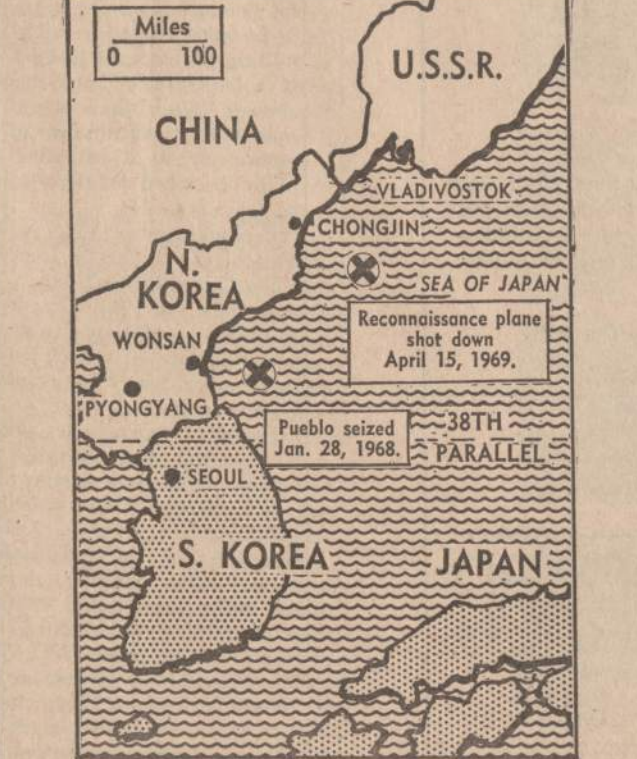
Japonų jūroje sovietų karo lėktuvai numušė JAV žvalgybos lėktuvą, skridusį apie šimtą mylių atstumu nuo Korėjos krantų. Ketvirtadienį rasti dviejų igulos narių lavonai. Amerikos karo laivai tikrina japonų jūros vandenį.

New Yorke 4-rių didžiųjų pasitarimai nedavė nieko naujo.