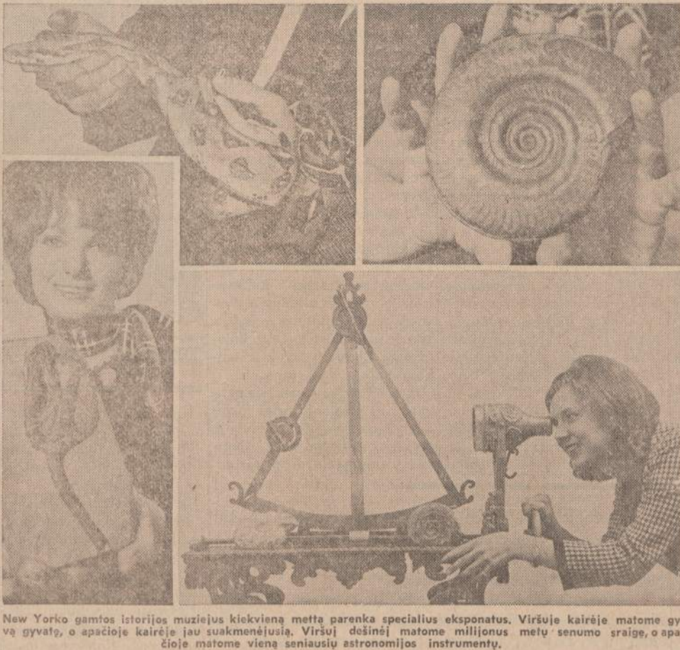
New Yorko gamtos istorijos muziejus kiekvieną metų parenka specialius eksponatus. Viršuje kairėje matome gyvą gyvatę, o apacioje kairėje jau suakmenėjusią. Viršuj dešinėje matome milijonus metų senumo sraigę, o apacioje matome vieną seniausių astronomijos instrumentų.

Bet grįžkime prie dalykų, kurie tiesioginiai rūpi mums paryškinti. Taigi, mūsų žiniomis, ir dabartinis LB Centro valdybos pirmininkas iš anksto buvo įspėtas, kad III Kultūros kongresas neš nuostolį. Jis taip pat buvo įspėtas, kad 2 spektakliai "Maro" ir kantatos padidins išlaidas ir tuo pačiu nuostolį. Nežiūrint to, buvo pasakyta, kad reikia duoti du spektaklius. Tą darbą vykdžiusieji tuo buvo įpareigoti