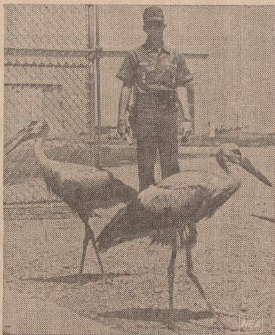
Klekvienu rudenį šie gandrai grįžta iš šiaurės Europos į Turkiją. Garniai vaikštinoja Amerikos aviacijos bazėje, esančioje Diyarbakir apylinkėje. Aukštame stulpe jie turi susinėję lizdus. Matyti, kad parskridę gandrai nebijo karių.