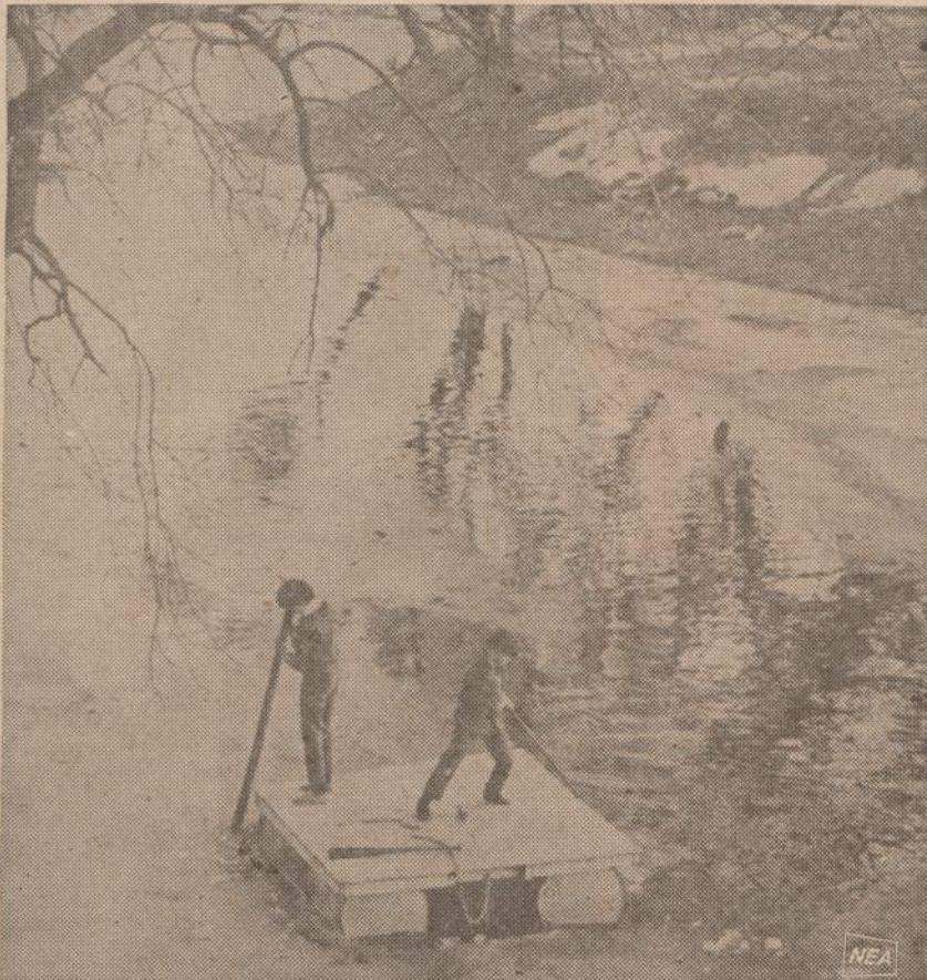
Du Mayville, Wis., miestelio vaikai, susikalę plūde, plaukia vandenings Rock upės vandenis. Jie nori pažinti kraštą ir pavasario upes.