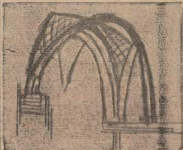
2) Gotikos stiliaus narviūra (sankryžminių lubų ir navų struktūra)

Pirmoji didelė gotikinė architektūra išsivysto tarp 1140 iki 1200 metų Ile-de-France, kur romaninis menas neturėjo stiprių šaknų.