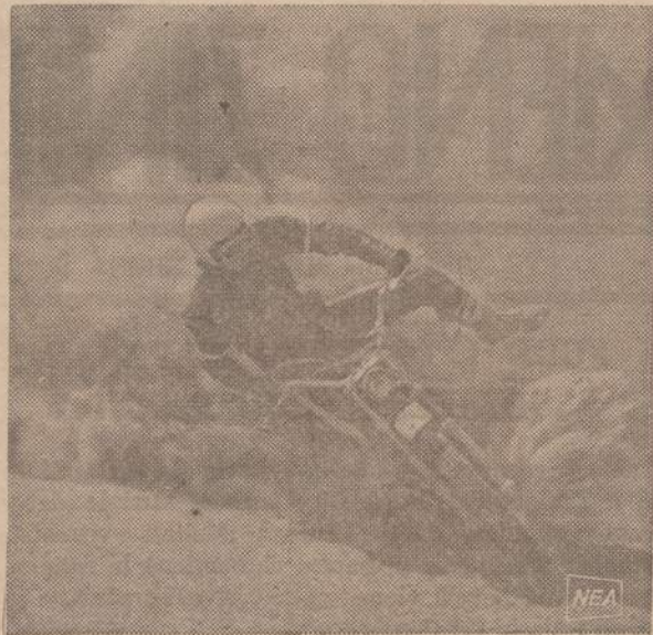
Paveiksle matome maticiklistą, įvažiuojantį į minkštą dirvožemį ir neišlaikiusį lygsvaros. Jis nukrito, bet nesusižeidė. Motociklai lengvai važiuoja kietu plentu, bet sustoja smėlyje arba minkštame juodžemyje.

ną, staiga neria į pakalnę ir vėl į kalną ir išlindęs per tunelius, apsukęs ratą apie kalną, vėl sustoja stotyje, iš kurios išvažiavo. Čia girdėjosi merginų klyksmas ir džiaugsmas, rodos, kad pasaulyje karo nėra. Be to, dauguma mėgdavo pasivažinėti ratu, kuris, rodos, buvo 300 metrų aukštumo. Pakilęs į viršų iš ten galėjo matyti visą miestą, kuris buvo lyg po kojomis.