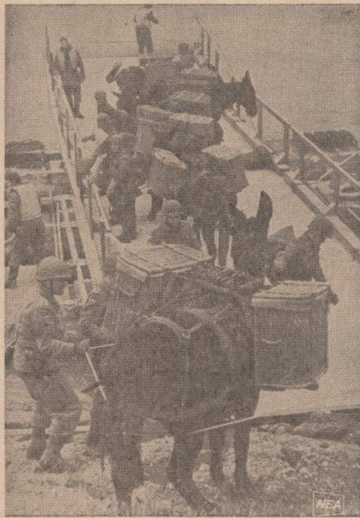
Naujoji vokiečių kariuomenė mechanizuota, bet be asilų jie vis dėlto neapsieina. Bavarijos kalnuose vyko manevrai. Modernios mašinos kainais negalėjo užuoti karo medžiagos atsargų, o asilai tai padarė. Vokiečių kariuomenėje yra 236 asilai.

moje iki Rio Leon, šiaurės-vakarų Kolumbijoje. Tame tarpe yra pavojingos Atrato pelkės, nemažos upės, tankios džiunglės. Sujungus jau pastatytas Panamerikos greitkelio dalis, pagyvės susisiekimas tarp šiaurės ir Pietų Amerikos.