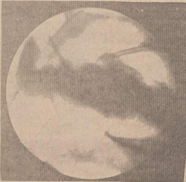
Marsas su savo "kanalais", kaip jis yra matomas teleskopais nuo Žemės.

Marsas yra gerokai mažesnis už Žemę. Marso skersmatis yra 6860 kilometrų, tuo tarpu kai Žemė prie ekvatoriaus turi 12,757 kilometrų skersmatis. Ta-