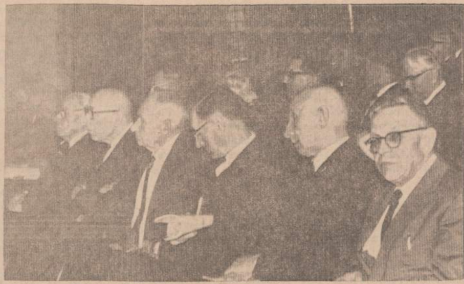
Jiems rūpi kitų nelsimės ir vargai. Balfo atstovai susimąstę Balfo jubiliejiniame seime klauso pranešimų apie vargstančius lietuvius pasaulyje.

Gi leidinio komisija sėkmingai dirbusi, surinko daug skelbimų ir tuo prisidėjo prie finansinių išteklių padidinimo. Čia daug sielos įdėjo pats pi-