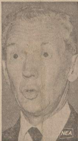
Maurice Couve de Murville