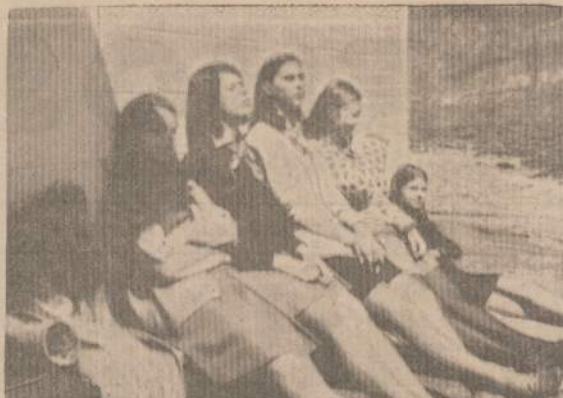
FOTO APARATO AKIS PAGAVO UŽMERKTAS AKUTES Tai sesės prieš saulotę per Dainavos sąskrydžio pertrauką.

Turbūt, ryškiausia šio sąskrydžio žymė tai gausus jauniesniųjų vadovų dalyvavimas. Šalia sąjungos "senųjų vilkų", buvusių ir dabartinių Vyr. Skautininkų, sk. spaudos redaktorių, svečių Tarybos narių, savo labai aktyviu dalyvavimu švytravo jaunieji vadovai — draugininkai-ės ir jų "stabistai". Tai bus gal jammausias bet kada įvykęs Seserijos-Brolijos suvažiavimas. O komentarai prie to labai trumpi: mes vis dar esame judrūs,