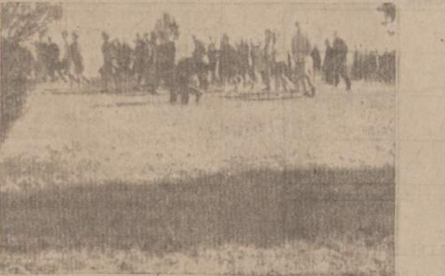
BENDRA KELIONE DAINAVOS ATSLAITĖMIS į bendrą Seserijos - Brolijos sueigą