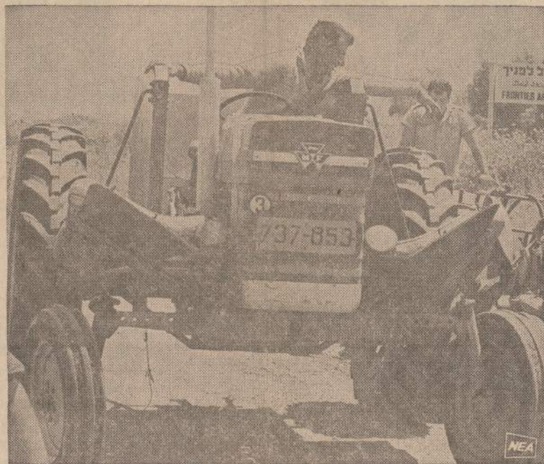
Arabai Izraelio keliuose dažnai padeda minų. Dėl to Izraelio ūkių traktoriai yra specialiai sustiprinti metalinėmis plokštėmis, kurios apsaugotų vairuotoją iš apačios, jei traktorius užvažiuotų ant minos.

◆ Darbo departamentas paskelbė, kad balandžio mėnesį Amerikoje truputį padaugėjo bedarbių. Jų buvę 2.5 milijonai.