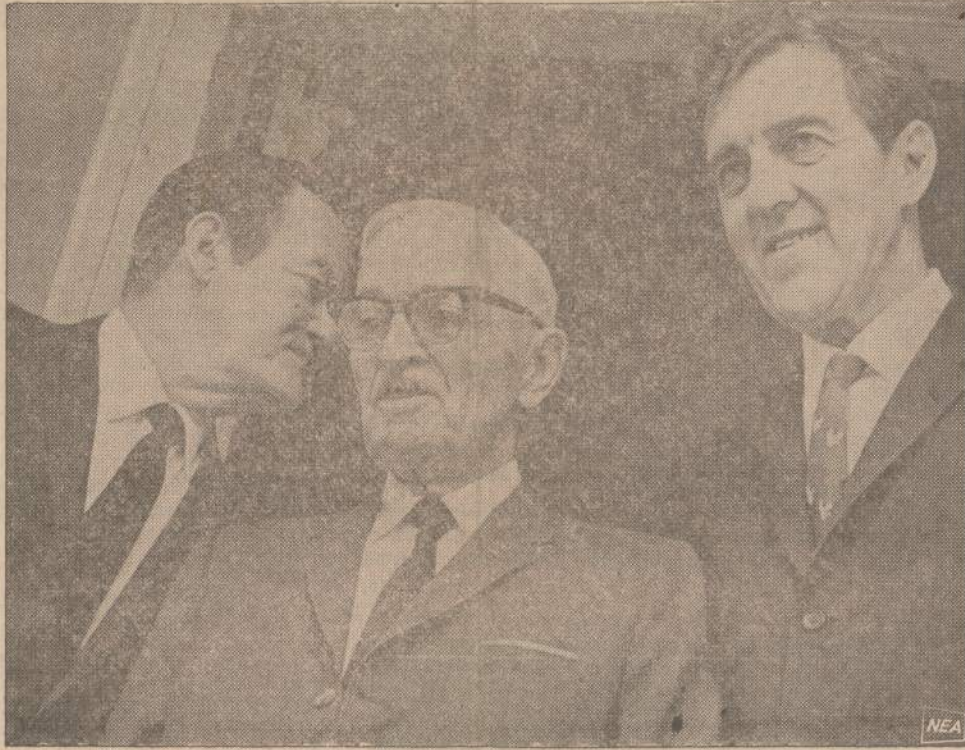
Ketvirtadienį, gegužės 8 d. buvęs JAV prezidentas Trumanas švenčia savo 85 metų gimimo sukaktį. Šioje fotografijoje jis stovi tarp demokratų partijos kandidato pernykščiuose rinkimuose: kandidato į prezidentus Hubert Humphrey ir — į viceprezidentus — senatoriaus Muskie.

Laikraštis sako, kad reikia išgelbėti tuos, kuriuos dar galima išgelbėti, nežūrint, kad jie buvo klasifikuoti kaip liaudies priešai. Reikia duoti jiems išieitį, reikia juos perminkyti, perauklėti ir su jais susijungti. Tas būsias proletariatui naudinga, o liaudies priešams kenksminga.