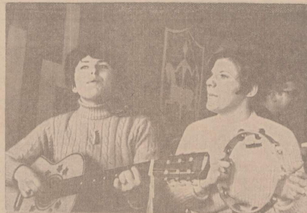
Dvi Waterburio lietuviškos linksmos amerikiečių II-je lietuvių dienoje Cornwall, Connecticut žiemos sporto centre. Šie lietuvių jaunimo parengimai pradeda prigyti Mohawk centre ir sutraukia didelės amerikiečių minias. Merginos priklauso "Dainuojančių Rūtų" būreliui.

HOME INSURANCE Call: Frank Zopolis 3208 1/2 W. 95th St. GA 4-8654 Share Farm Fire and Casualty Company