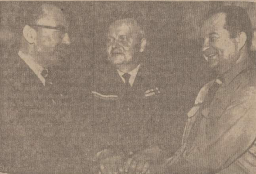
CLEVELANDO PILIENŲ TUNTO VADOVYBEI KEIČIANTIS