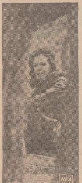
Amerikoje pradėjo garsėti jauna rašytoja Jacqueline Susann. Čia ji New Yorko parke planuoja naują romaną.

CHALAN KANOA. — JAV vidaus reikalų sekretorius Hickel pažadėjo Mikronezijos saloms daugiau autonominių teisių ir savivaldą. Bus statoma daugiau kelių, elektros jėgainių ir sulygintos vietinių gyventojų ir amerikiečių gaunamos algos.