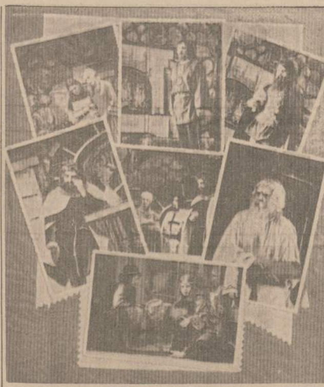
"Aukuro" vaidinamos "Mindaugo mirties" vaizdų vinjetė

Antai, kitą šeštadienį, gegužės 17, atvažiuoja Hamiltono lietuvių teatro "Aukuro" puska-pis žmonių. Atvažiuoja, kaip minėjau praėjus, su Vinco Krėvės 4 v. drama "Mindaugo mirtim". Kviečia St. Butkaus šaulių kuopa. Dėl pobūvių gausos kvietė-ja kurį laiką abejojo, bet pačių aukuriečių buvo tiesiog prie sienos priremti. Ką, sako, lietuvių klasiko veiklas, o ne vestininko koks. Net 27 aktoriai, daugiausia jaunimas. Jūs, sako, mūsų artimiausi kaimynai Amerikoje. Jūsų kolonija didelė. Pas jus