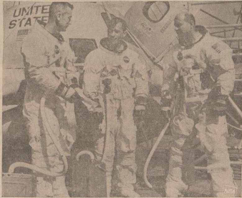
Apollo 10 astronautai rengiasi svarbiai kelionei gegužės 18 d. Iš kairės Eugene Cernan, John Young ir erdvėlaivio komendantas Thomas Stafford.

Straiptinio autorius siūlo keisti kainų struktūrą, keisti atlyginimų sistemą, kad žmonėms nereikėtų lakstyti po visą miestą, ieškant paprasčiausių prekių.