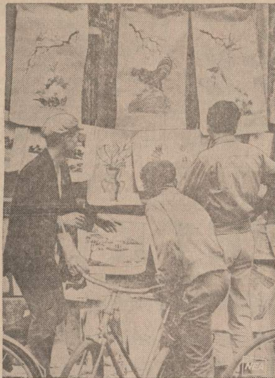
Šiaurės Vietnamo komunistų propaganda paskelbė šia nuotrauką, kur matomas dailininkas, gatvėje išstatęs savo kūrinį parodą.