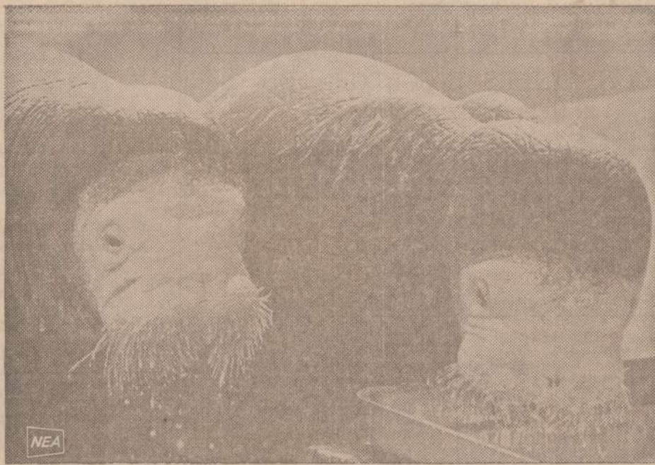
Jūros arkliai labai mėgsta įvairias straiges ir žuvis. Kalifornijos jūrų gyvūnų parke jauni jūros arkliai maitinami išplakta grietinėle, kurioje pridėta silių ir straigų. Matosi, kad edikai nelabai žiūri gražių manierų ir kigalvas į lovį iki pat ausu.

Priima ligonius pagal susitarimą. Dėl valandos skambinti telefonu HE 4-2123 jei neatšiliepiama, tai telefonai: GI 8-6198