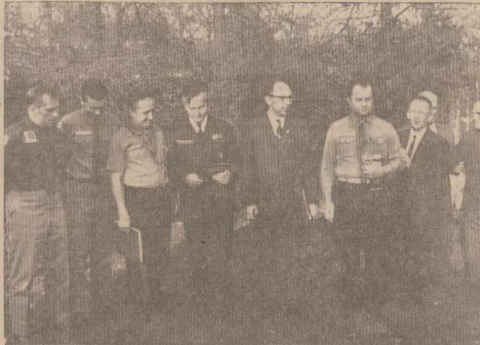
CLEVELANDO PILIENŲ TUNTO VADOVAI SU SVEČIŲ VYRIAUSIŲ SKAUTININKŲ

Šiuos pasiūlymus suvažiavimui pateikė jame dalyvavę JAV