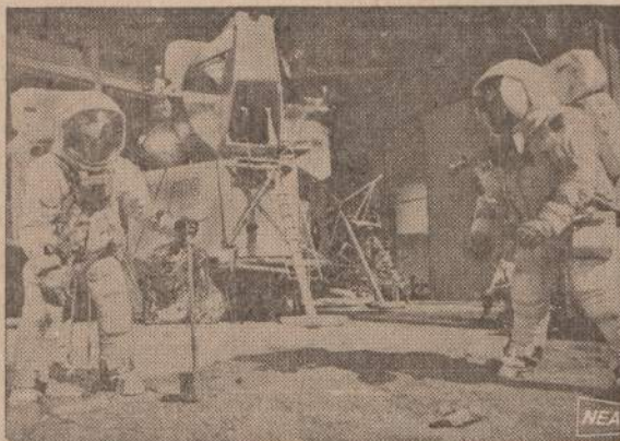
Apollo 11 astronautai rimtai ruošiasi kelionei į Mėnulį. Viršuje Edvin Aldrin ir Neil Armstrong pratinasi vartoti geologinius įrankius Texas dykumoje. Tais įrankiais jie paims nuo Mėnulio paviršiaus akmenų ir smėlio pavyzdžių. Apačioje astronautai dirba apsirėngę "Mėnulio rūbais".