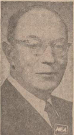
Henry J. Friendly