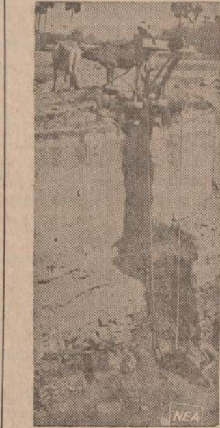
Indijoje, Madras provincijoje siaučia didelė sausra. Ūkininkai renka van- denį iš įvairiausių šaltinių ir duobių.