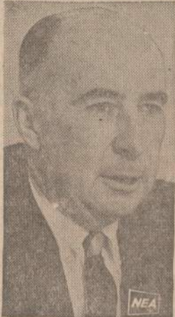
John N. Mitchell

Alain Poher remia Europos vienybę ir apjungimą ekonominiams ir politiniams ryšiams. Todėl ir Pompidou turės pažadėti šia kryptimi nuolaidesnę laikyseną už buvusią de Gaulle'io laikyseną.