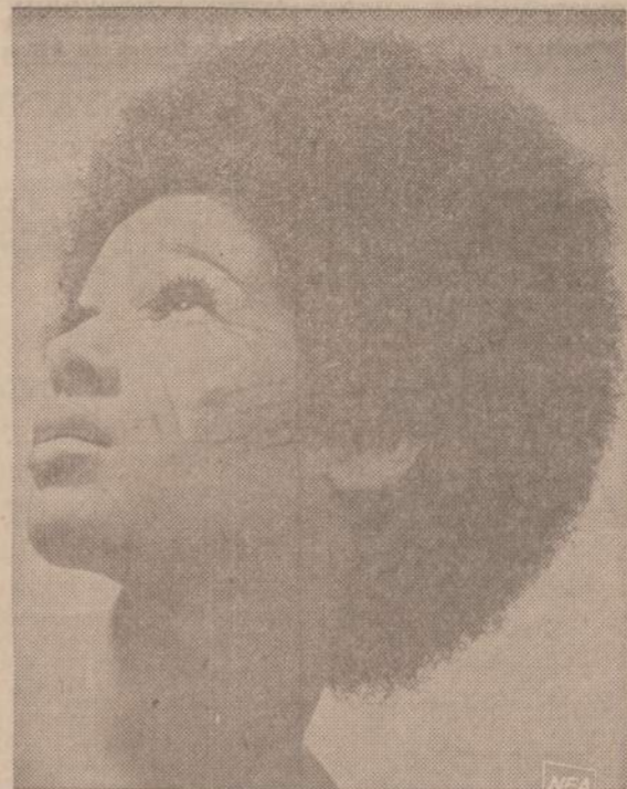
Montrealio plauku šukuotojas sugalvojo Afrikos stiliaus peruką, va- dinamą "Zulu". Tokius gali įsigyti ne tik juodos, bet ir baltos mer- ginos.

"NAUJIENOS" KIEKVIENO DARBO ŽMOGAUS DRAUGAS IR BIČIULIS