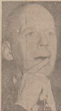
Herbert Brownell Jr.