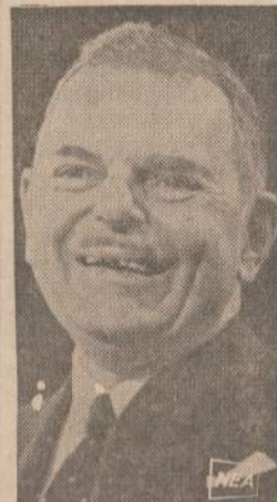
Thomas E. Dewey