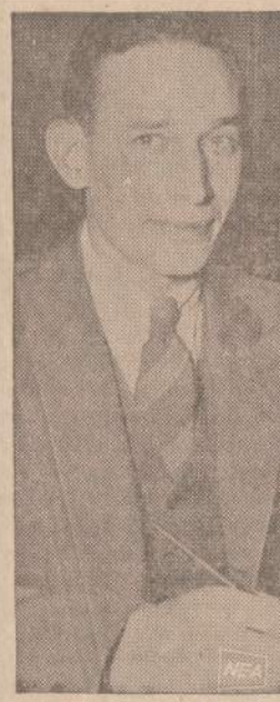
Pastraukęs teisėjas Abe Fortas, jauną teisėninką iš Tennessee, atvykęs į Washingtoną greit susirado įtakingų draugų. Prezidentas Johnsonas jį norėjo padaryti Aukščiausiojo Teismo pirmininku, bet senatas nesutiko jį patvirtinti, o vėliau paaiškėjo "Wolfsono afera", kurioj išlėvė Fortas, turėjo pasitraukti iš pareigų.