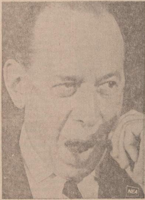
Buvęs Aukščiausiojo Teismo narys, teisėjas Abe Fortas nuobodžiaudamas klauso neįdomios bylos.