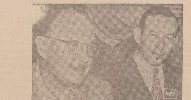
Buvęs Aukščiausiojo Teismo narys Abe Fortas 1950 metais pagarsėjo, kaip apkaltintų komunistų gynėjas. Čia jis matomas (dešinėje) su Owen Lattimore, kurį tardė senato komitetas.

Sovietinės koegzistencijos prasme jau anksčiau (1959 m. Albanijoje) yra atskleidęs Kruščiovas, kalbėdamas užsienių reikalų ministerių konferencijos išvakarėse. Štai ką jis pareiškė: "Kapitalistai sako, jog su S. Sąjunga reikia derėtis sekant — nuolaida už nuolaidą. Bet tai yra kup-