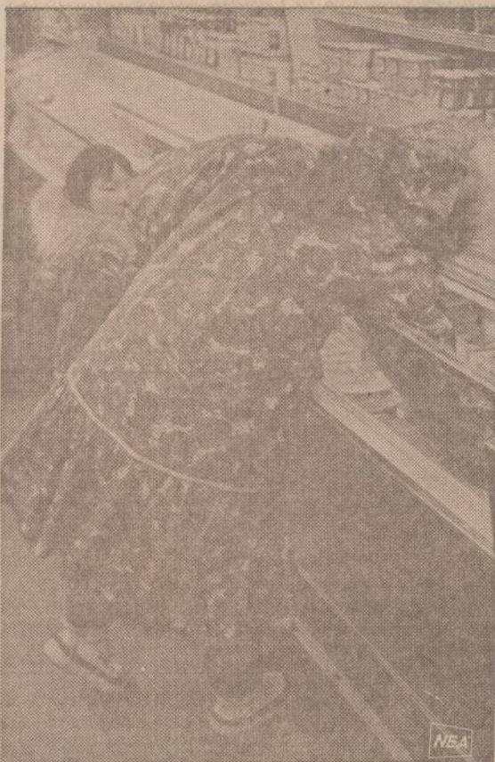
Amerikiečiai kalbėdami apie labai sumanų pardavėją, sako, kad jis sugebėtu net paruoti eskimui šaldytuvą. Paveikslė matoma eskimų moterį, renkančią prekes Barrow miesto Aliaskoje krautuvės šaldytuvų maisto produktų sekcijoje.