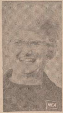
Ponios Dorothy Elston parašas greit pasklis po visą Ameriką ir visą pasaulį. Ji, kaip nauja JAV izdininkė, pasirašys ant visų popierinių pinigų.

WASHINGTONAS. — JAV vyriausybė paskelbė dokumentus, iš kurių matosi, kad jau prezidentas suprato, kad Izraelio valstybė galima bus išlaikyti tik jėga ir nuolatine kovą. Jam taip aiškino jo patarėjai Viduriniuose Rytuose.