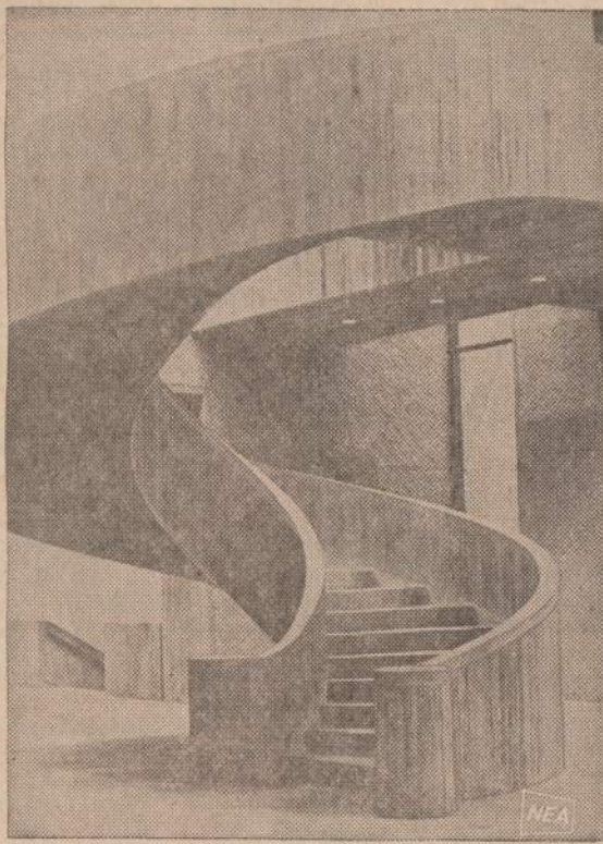
Syracuse, Eversono Meno muziejaus pastatas buvo apdovanotas 1969 metų New Yorko premija. Ne tik muziejuje laikomi meno turtai, bet ir pats pastatas yra laikomas meno laimėjimu. Čia matomi Skulptūros Kiemo laiptai.

A. ABALL ROOFING Įkurta prieš 50 metų VISOKIUS STOGUS, rinas ir nutekamuosius vamzdžius sutaisome arba naujus įdedame. KAMINUS IŠVALOME ir pataisome. Nudažome namus iš lauko ir atliekame "tuckpointing" darbus. Esame apdrausti, visas darbas garantuotas. Skambinkit LA 1-6047 arba RO 2-8778 (Kainavimas veitul, kreipkitės bet kada,