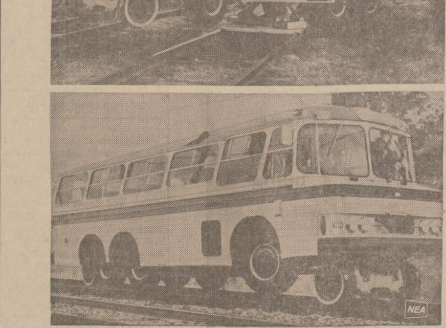
Australijoje pagamintas autobusai, kuris gali važinėti keliais ir geležinkeliais. Viršuje rodomas metodas, kaip autobusas vieno žmogaus pastatomas ant bėgių. Iš paties centro išleidžiamas automatinis kėlikas. Vairuotojas įtraukia guminius ratus ir nuleidžia autobuso geležinių ratų ant bėgių, kuriais jis gali važiuoti 50 mylių per valandą.

Jau dabar visi lietuviai susiorganizuokime į vienetus, apsiėmusius visus apylinkėje besirodantius vaikus reikiamai tvarkyti. Nežiūrint kieno vaikas elgiasi blogai — pastokime blogiui kelią ir veskime vaiką visais galimais būdais tokį sutvėrimą į asmenybę įsigyti pajęgia žmogystą. Beasmeniai tėvai, ypač tokios motinos protestuos prieš jo vaiko tvarkymą — ji, mat, visiems tvirtina, kad jos vaikas geriausias apylinkėj — vis tik kiti vagia, daržus mīna, langus, butelius daužo. Pavyzdį tokios elgsenos duoda keliolika amerikiečių brandžių šeimų. Jos įsigi-